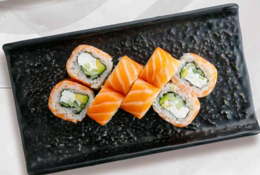
ФИЛАДЕЛЬФИЯ С ЛОСОСЕМ