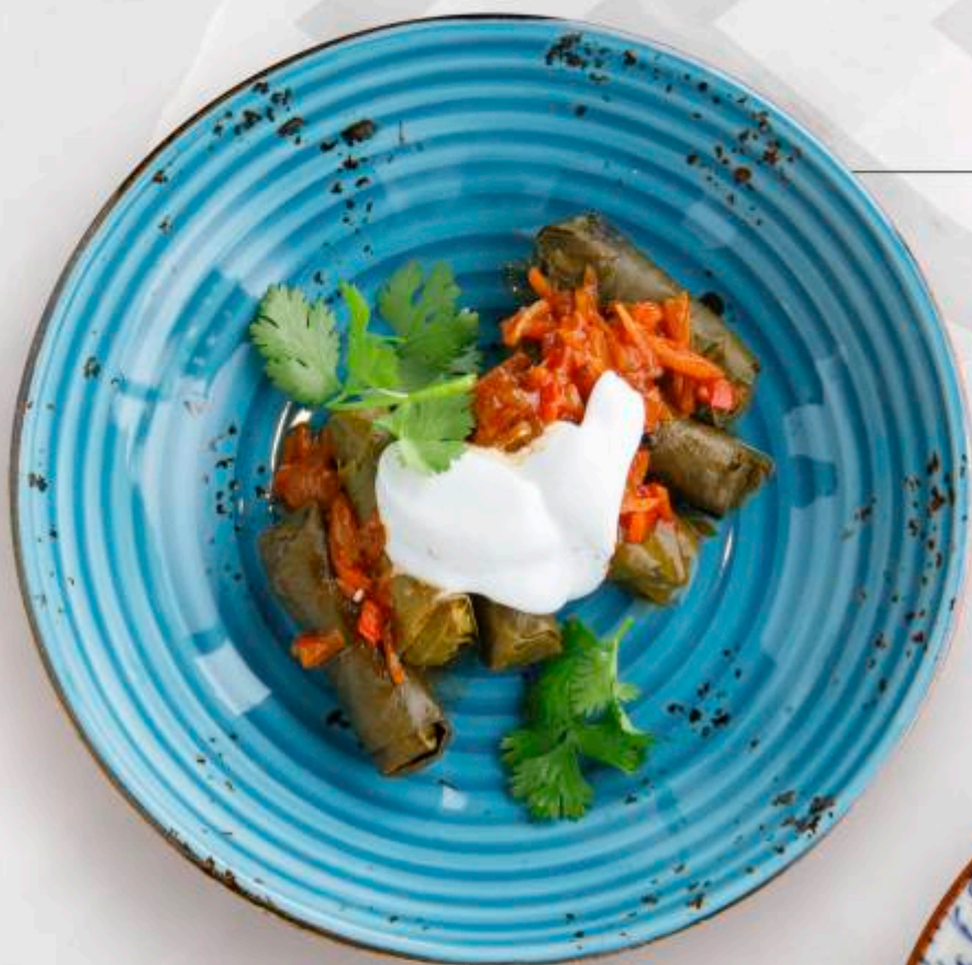
ДОЛМА С ГОВЯДИНОЙ И СВИНИНОЙ