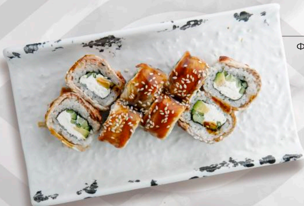
ФИЛАДЕЛЬФИЯ С УГРЕМ