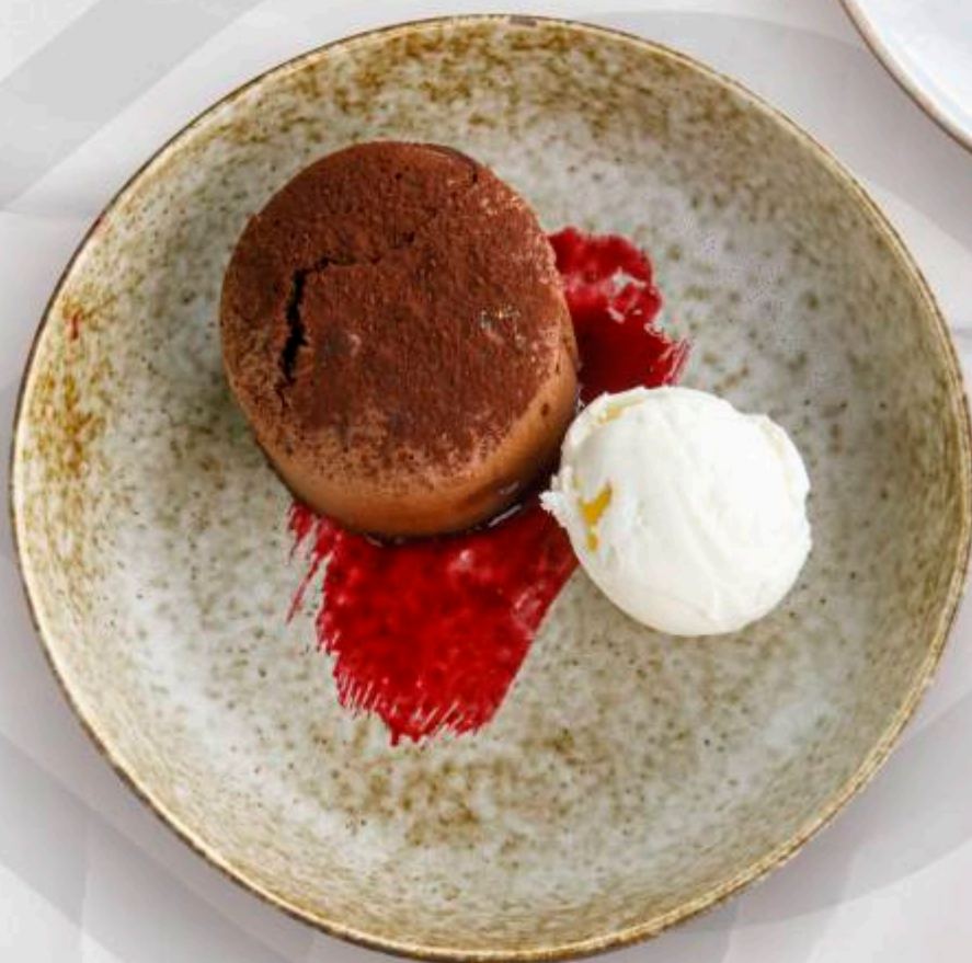
КЕКС ГОРЯЧИЙ ШОКОЛАД