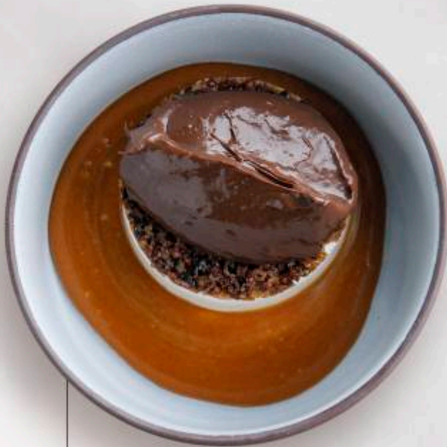
ШОКОЛАДНЫЙ ГАНАШ С КОФЕЙНОЙ ПАНАКОТОЙ