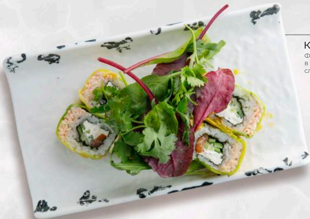
КРАБЫ НА КРЫШЕ

Филе лосося со снежным крабом в сочетании с огурцом, сливочным сыром, слайсом авокадо с миксом салата