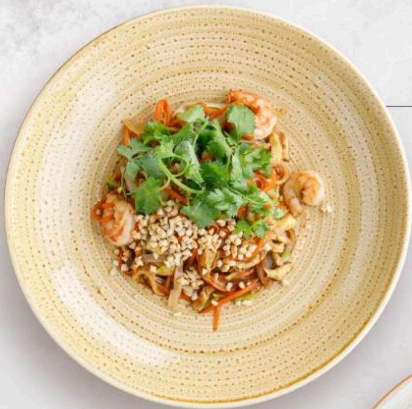
ПАД ТАЙ С КРЕВЕТКАМИ