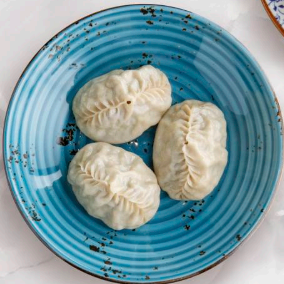
МАНТЫ С РУБЛЕННЫМ ЯГНЕНКОМ И ИНДЕЙКОЙ