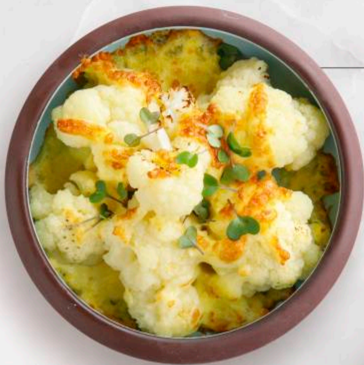
ЦВЕТНАЯ КАПУСТА С СЫРОМ СУЛУГУНИ