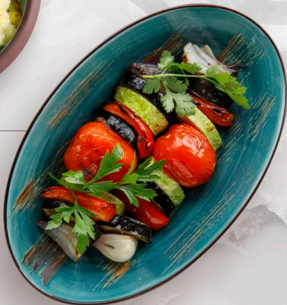
ШАШЛЫК ИЗ ОВОЩЕЙ