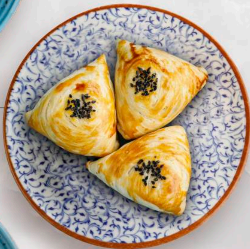
САМСА С ГРИБАМИ И БАКЛАЖАНАМИ