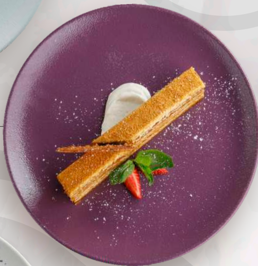
МЕДОВИК ИЗ ХЛОПКОВОГО МЕДА