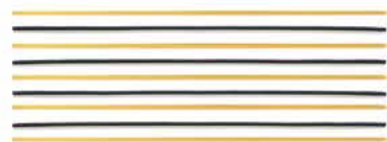
СПАГЕТТИ / SPAGHETTI / 长意粉