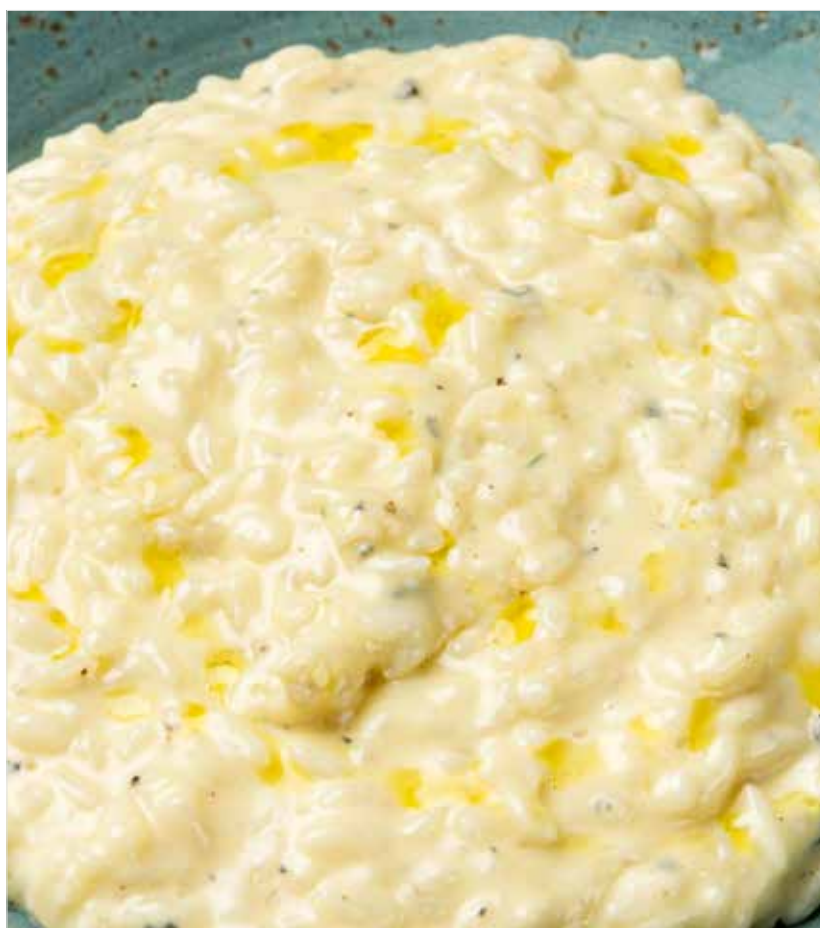
РИЗОТТО «ЧЕТЫРЕ СЫРА»