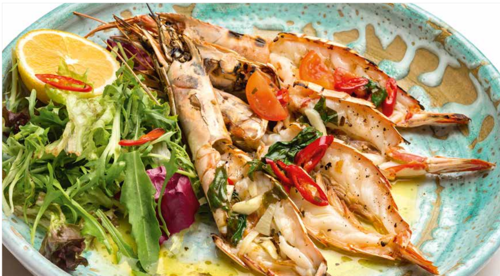
КРЕВЕТКИ ПО-КАТАЛОНСКИ ..... 1590 Catalan-style shrimps 加泰罗尼亚虾