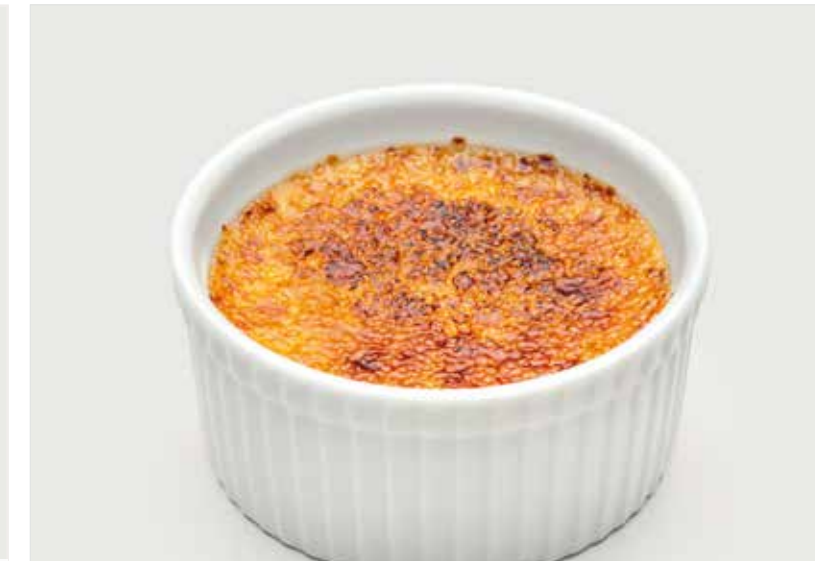
«КРЕМА КАТАЛАНА» ..... 280 Catalana cream 卡塔隆奶油饼