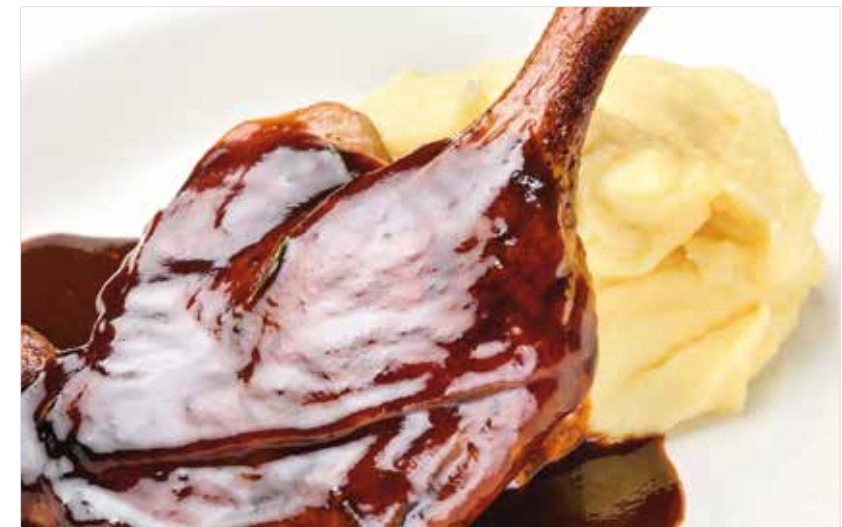
УТИНАЯ НОЖКА КОНФИ С КАРТОФЕЛЬНЫМ ПЮРЕ