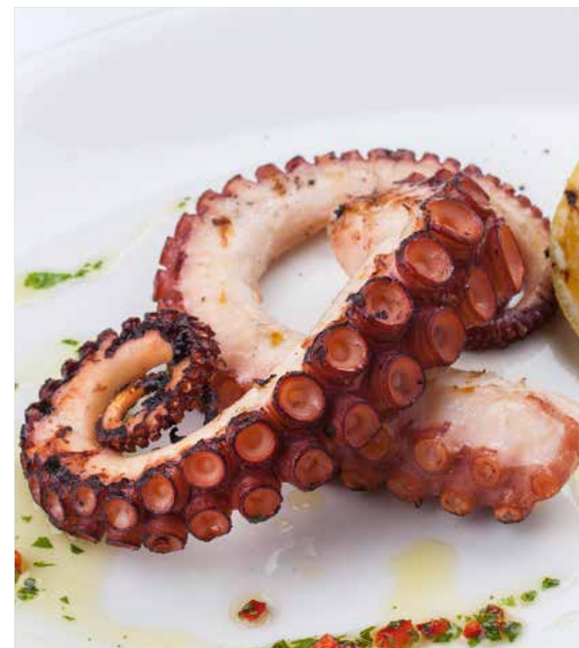
ОСЬМИНОГ НА ГРИЛЕ Grilled octopus 烧烤八爪鱼