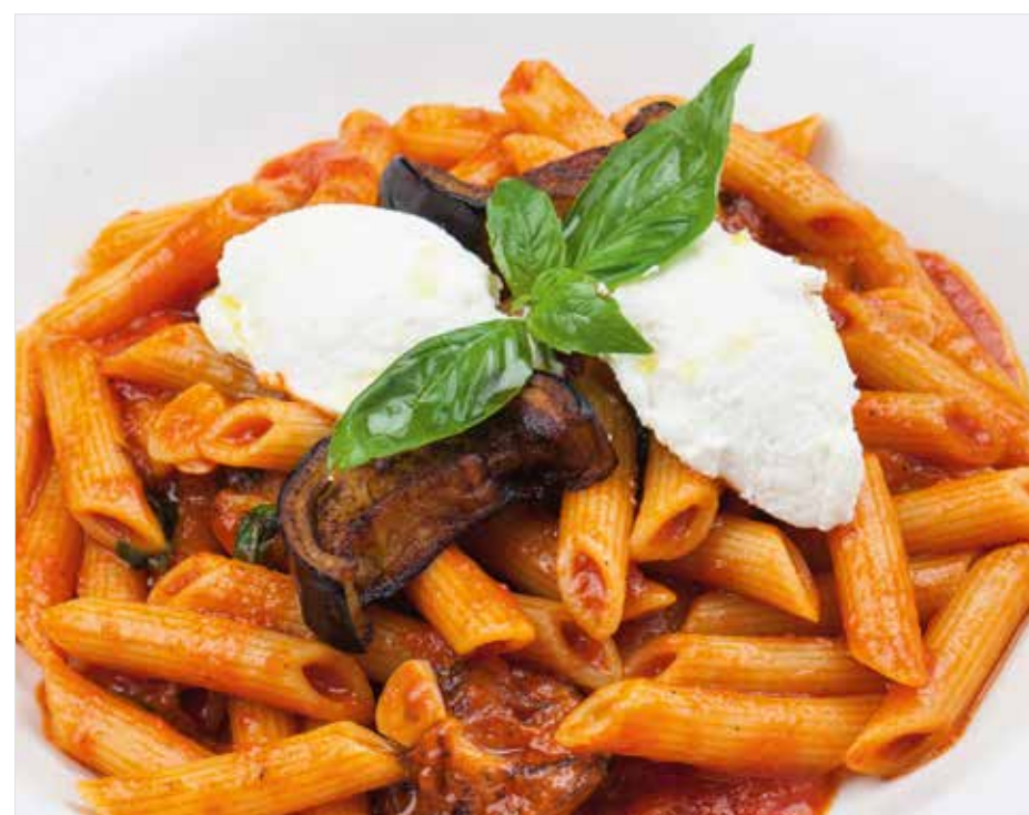
ПЕННЕ С БАКЛАЖАНОМ И РИКОТТОЙ ..... 560 Penne with eggplant and ricotta 直通粉, 茄子, 里科塔奶酪