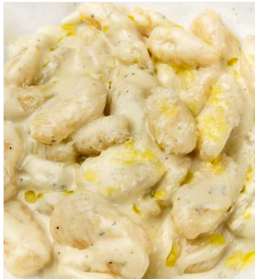
НЬОККИ «ЧЕТЫРЕ СЫРА» ..... 740 Gnocchi Four cheese “四种奶酪”玉棋