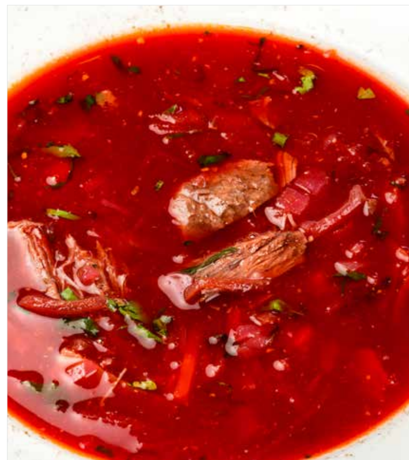
БОРЩ СО СМЕТАНОЙ Borscht with sour cream 红菜汤加酸奶油

ПРОСЬБА ПРЕДУПРЕЖДАТЬ ВАШЕГО ОФИЦИАНТА ОБ ИМЕЮЩЕЙСЯ У ВАС АЛЛЕРГИИ НА ОПРЕДЕЛЕННЫЕ ПРОДУКТЫ ПИТАНИЯ PLEASE TELL YOUR WAITER IF YOU HAVE ANY FOOD ALLERGY | 如果您对某些饮食会产生过敏反应, 请通知您的服务员 所有价格是俄罗斯卢布价格