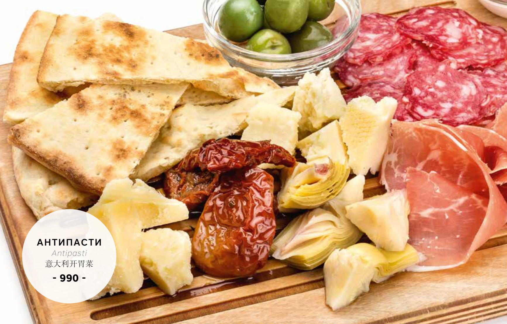
АНТИПАСТИ Antipasti 意大利开胃菜 - 990 -