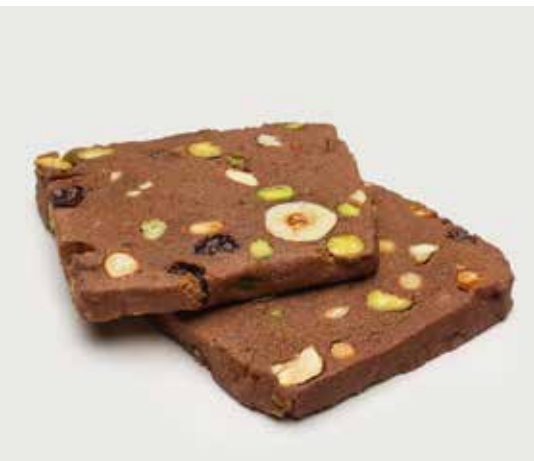
ПЕЧЕНЬЕ С СУХОФРУКТАМИ И ОРЕХАМИ ..... 140 Cookie with dried fruits and nuts 巧克力饼干