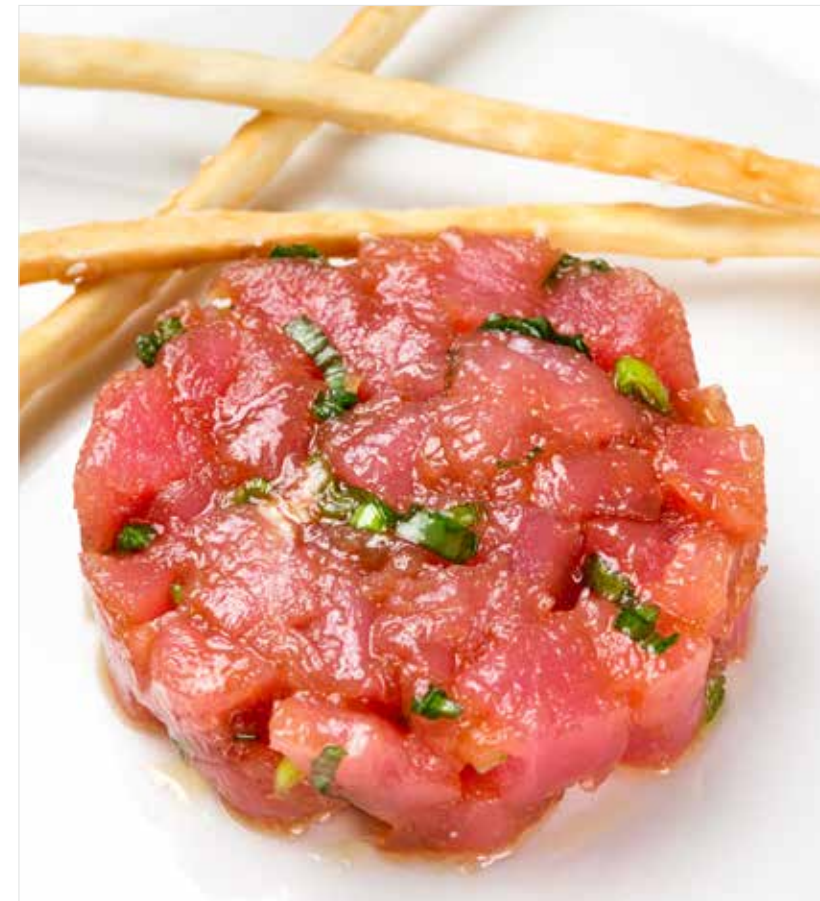
ТАРТАР ИЗ ТУНЦА Tuna tartare 吞拿鱼塔塔