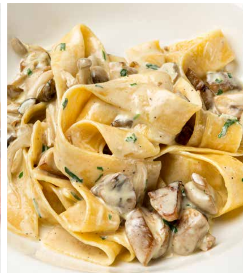
ПАППАРДЕЛЛЕ С ГРИБАМИ ..... 690 Pappardelle with mushrooms 蘑菇长通粉

ПРОСЬБА ПРЕДУПРЕЖДАТЬ ВАШЕГО ОФИЦИАНТА ОБ ИМЕЮЩЕЙСЯ У ВАС АЛЛЕРГИИ НА ОПРЕДЕЛЕННЫЕ ПРОДУКТЫ ПИТАНИЯ PLEASE TELL YOUR WAITER IF YOU HAVE ANY FOOD ALLERGY | 如果您对某些饮食会产生过敏反应, 请通知您的服务员 所有价格是俄罗斯卢布价格