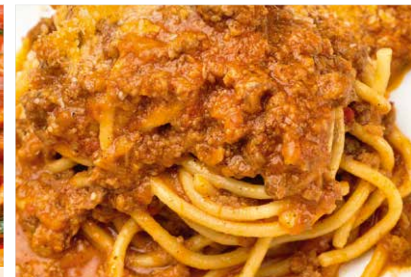
«БОЛОНЬЕЗЕ» ..... 640 Bolognese 番茄肉酱意大利面条