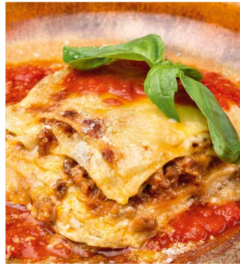
ЛАЗАНЬЯ ..... 690 Lasagna 千层面