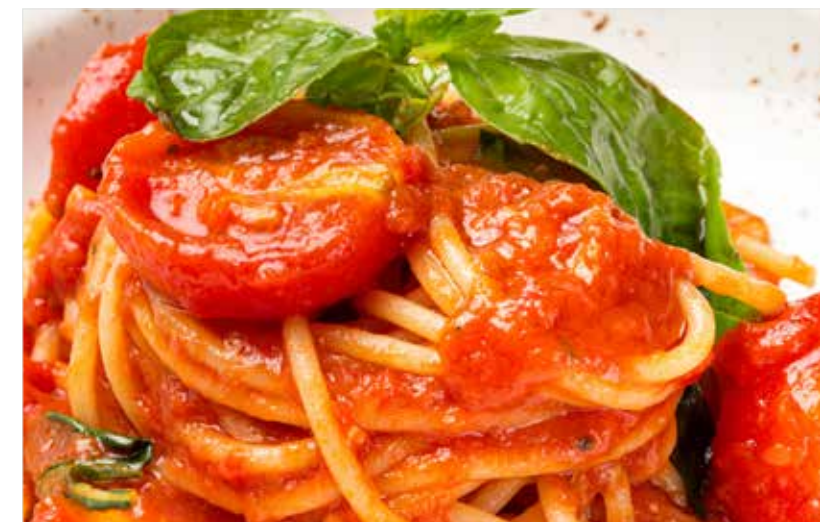
СПАГЕТТИ С ТОМАТАМИ ЧЕРРИ И БАЗИЛИКОМ ..... 390 Spaghetti with cherry tomatoes and basil 罗勒圣女果意面