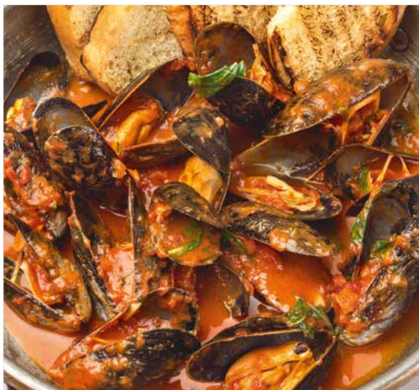
СОТЕ ИЗ МИДИЙ В ТОМАТНОМ СОУСЕ / БЕЛОМ ВИНЕ ..... 890 Sauteed mussels in tomato sauce / white wine 番茄酱烧蚝 / 白葡萄酒烧蚝