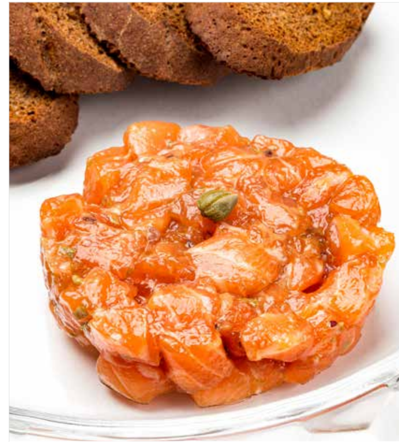
ТАРТАР ИЗ ЛОСОСЯ Salmon tartare 三文鱼塔塔

Ⓜ Без глютена / Gluten free / 不含麸质 Ⓝ Вегетарианское / Vegetarian dish / 素食 Ⓟ Безлактозное / Lactose-free dish / 免乳糖