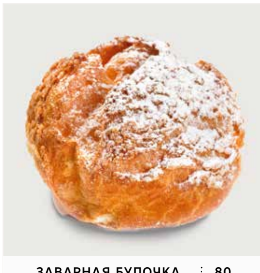
ЗАВАРНАЯ БУЛОЧКА С КРЕМОМ ..... 80 Custard bun 奶黄包