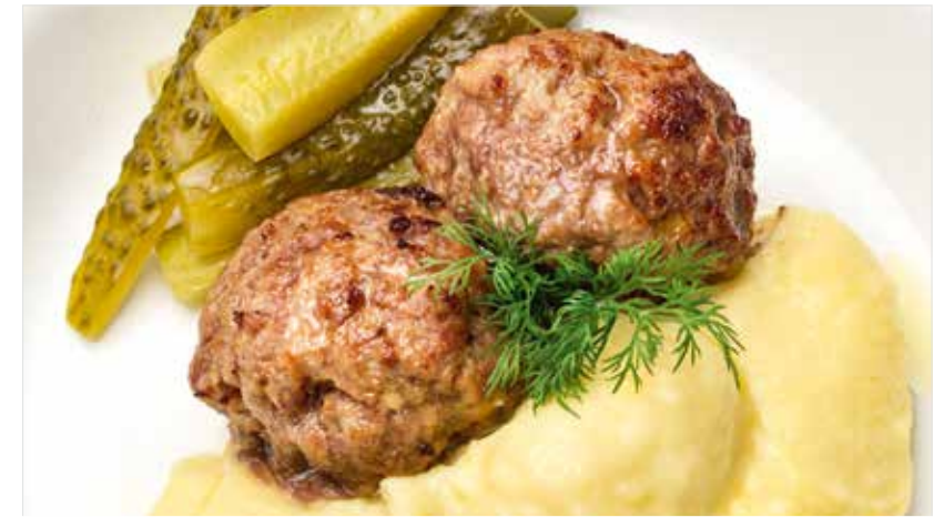
ДОМАШНИЕ КОТЛЕТЫ / КОТЛЕТЫ ИЗ ИНДЕЙКИ С КАРТОФЕЛЬНЫМ ПЮРЕ

Homemade patties with mashed potatoes / turkey patties with mashed potatoes