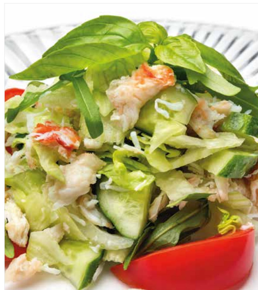
САЛАТ С КАМЧАТСКИМ КРАБОМ Salad with king crab 红王蟹沙律