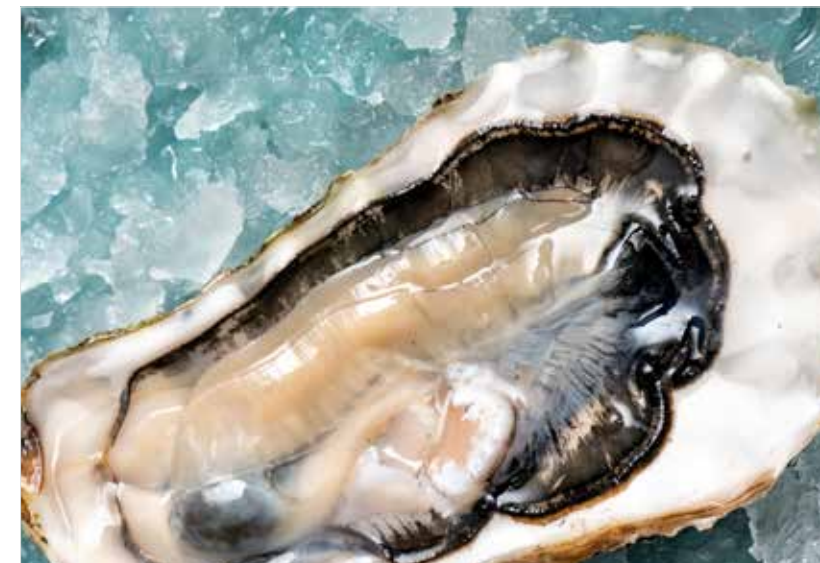
УСТРИЦА (1 ШТ.) ..... 290 Oyster, 1 pc 蚝, 一只