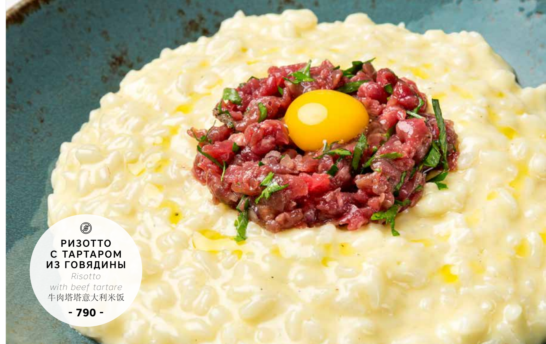
РИЗОТТО С ТАРТАРОМ ИЗ ГОВЯДИНЫ