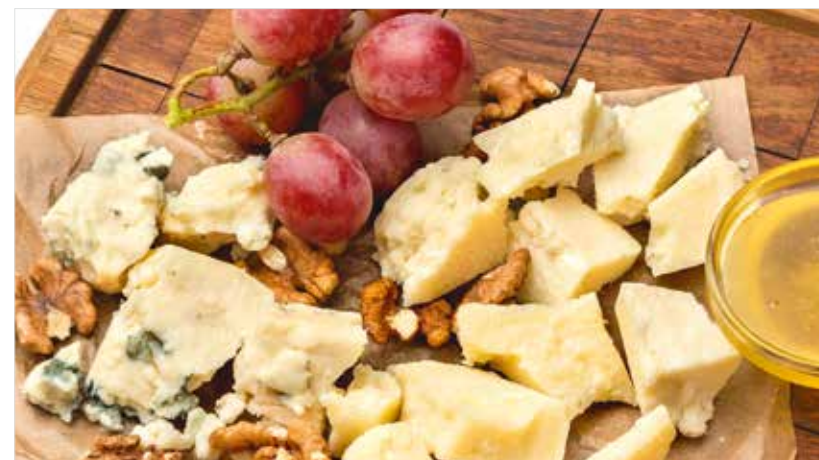
СЫРНАЯ ТАРЕЛКА (грана падано, пекорино, горгонзола) ..... 990 Cheese plate (grana padano, pecorino, gorgonzola) 奶酪盘 (格拉娜 帕达诺奶酪, 佩科里诺奶酪, 戈贡佐拉奶酪)