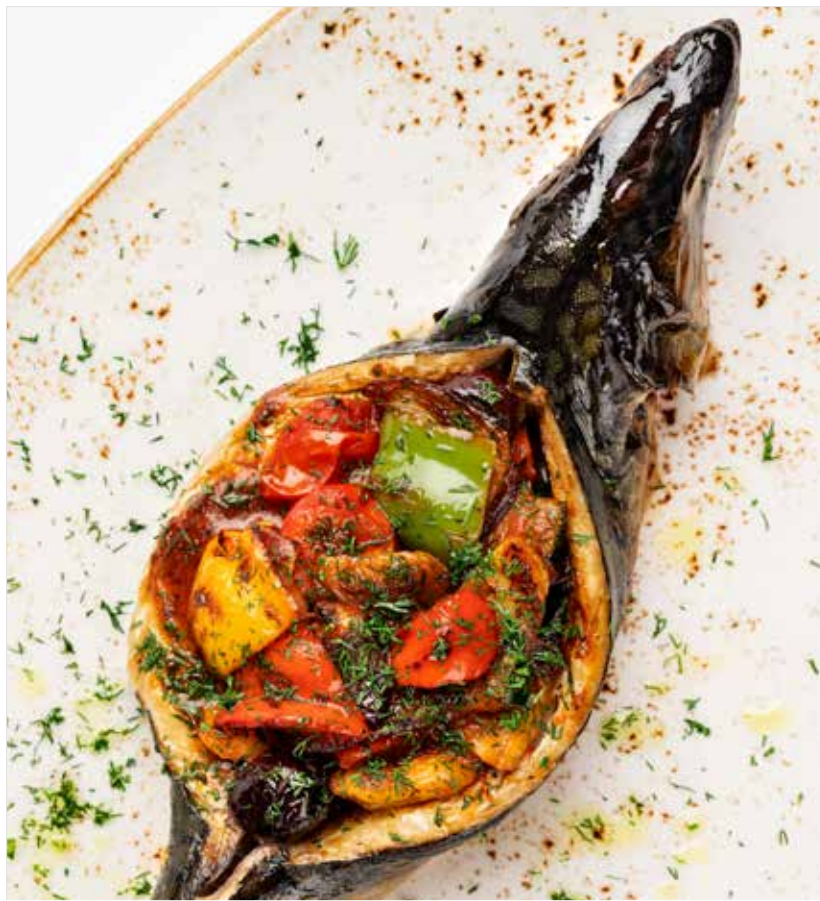
СКУМБРИЯ ЗАПЕЧЁННАЯ С ОВОЩАМИ ..... 990 Baked mackerel with vegetables 烤鲭鱼搭配蔬菜