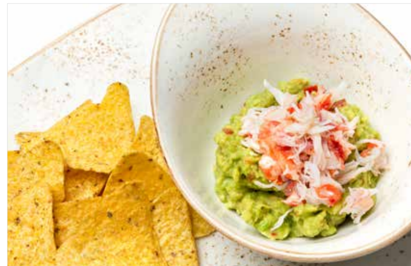
ГУАКАМОЛЕ КЛАССИЧЕСКОЕ / С КРАБОМ ..... 490 / 990 Classic guacamole / with crab 原味牛油果酱 / 螃蟹牛油果酱

☞ Без глютена / Gluten free / 不含麸质 ☑ Вегетарианское / Vegetarian dish / 素食 ☒ Безлактозное / Lactose-free dish / 免乳糖