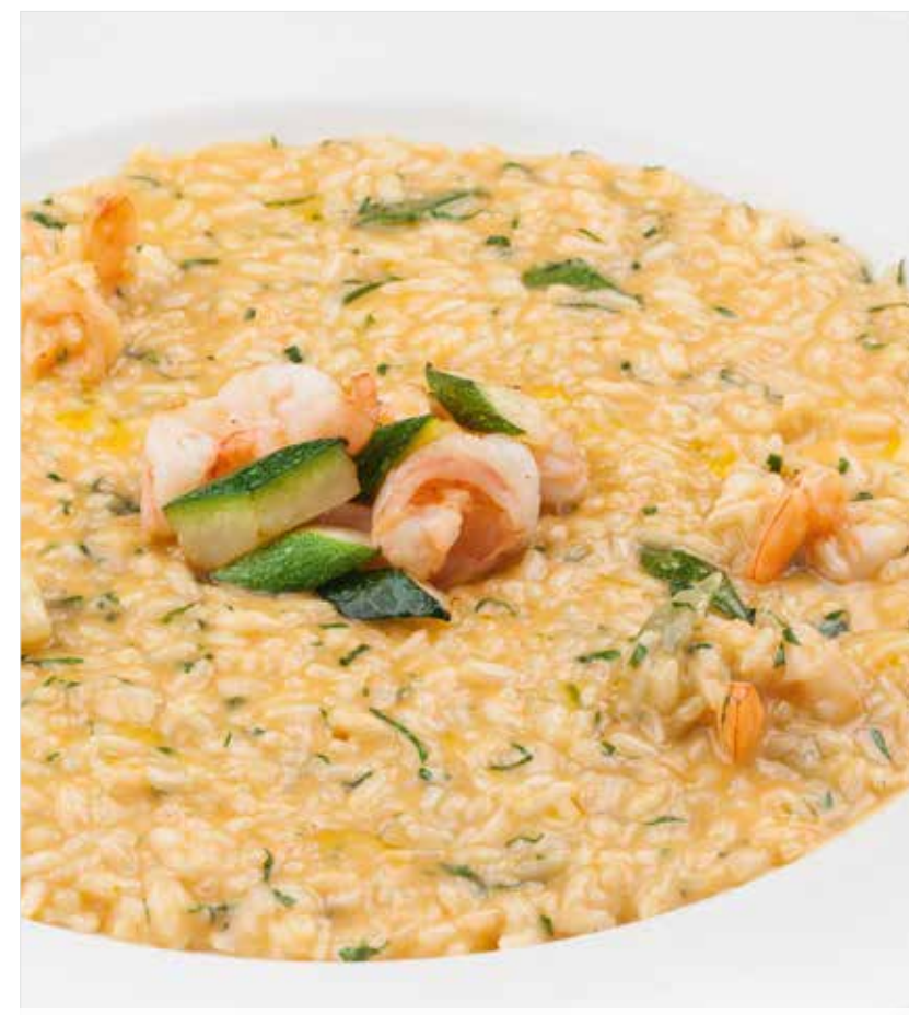
РИЗОТТО С ЦУКИНИ И КРЕВЕТКАМИ

Risotto with zucchini and shrimps 意大利瓜鲜虾烩饭