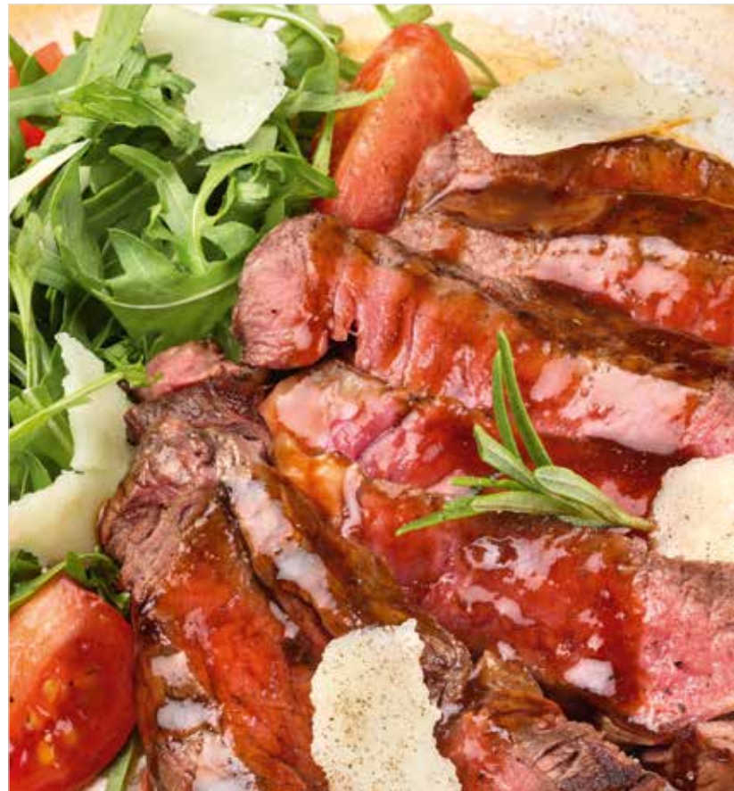
ТАЛЬЯТА ИЗ ГОВЯДИНЫ