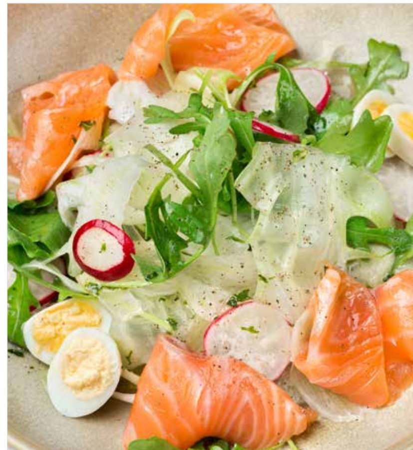
САЛАТ С КОПЧЕНЫМ ЛОСОСЕМ Salad with smoked salmon 熏三文鱼沙拉