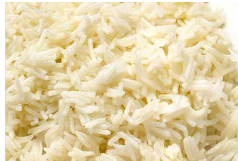
РИС БАСМАТИ ..... 140 Basmati rice 印度香米

БРОККОЛИ С СЫРОМ ..... 590 Broccoli with cheese 西兰花配干酪