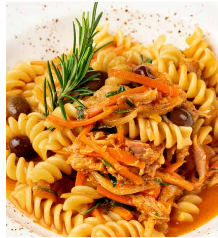
ФУЗИЛЛИ С КРОЛИКОМ ..... 890 Rabbit fusilli 兔肉螺旋粉