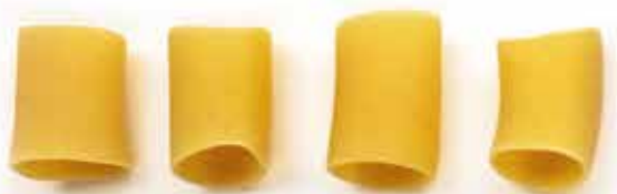
ПАККЕРИ / PACCHERI / 特大水管通心粉