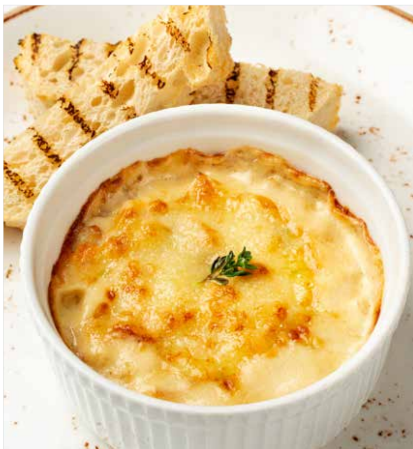
ЖУЛЬЕН С МОРЕПРОДУКТАМИ ..... 790 Seafood julienne 海鲜盅