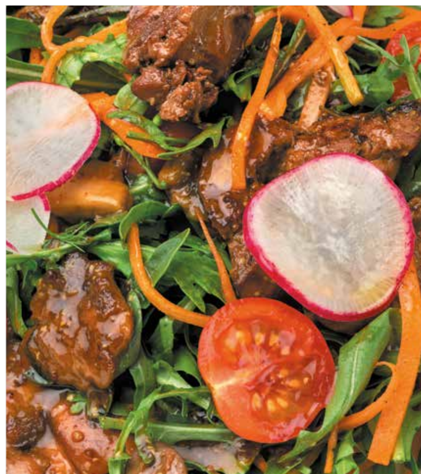
РУКОЛА С КУРИНОЙ ПЕЧЕНЬЮ Arugula with chicken liver 鸡肝芝麻菜