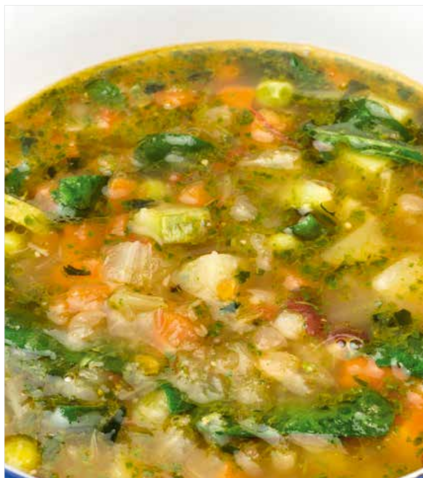
МИНЕСТРОНЕ Minestrone 意大利杂菜汤