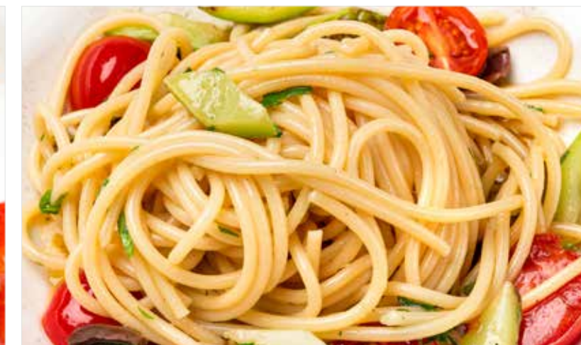
СПАГЕТТИ С ЦУКИНИ, ОЛИВКАМИ И ТОМАТАМИ ЧЕРРИ ..... 390 Spaghetti with zucchini, olives and cherry tomatoes 意大利面配西葫芦, 橄榄和樱桃番茄