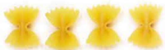
ФАРФАЛЛЕ / FARFALLE / 蝴蝶粉