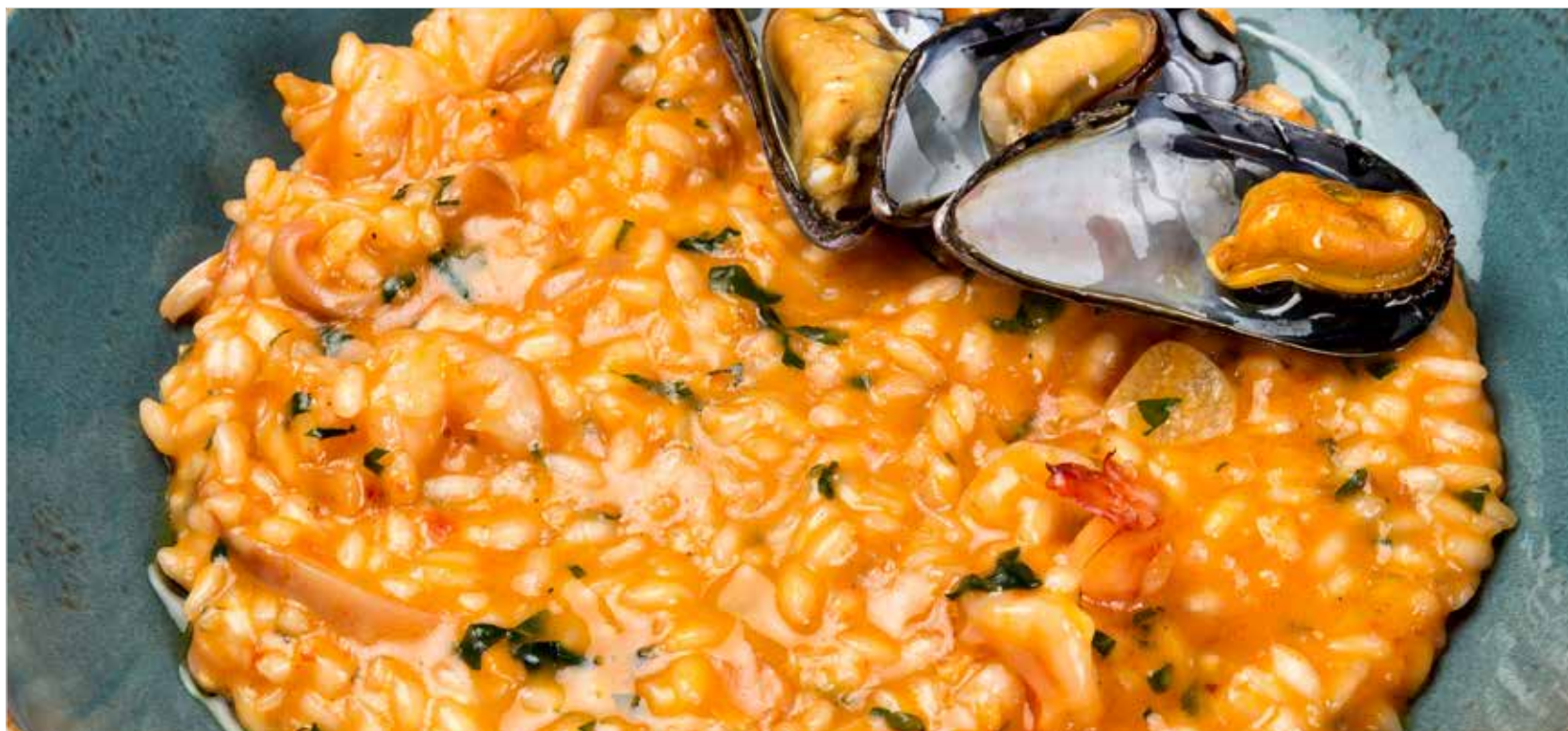
РИЗОТТО С МОРЕПРОДУКТАМИ