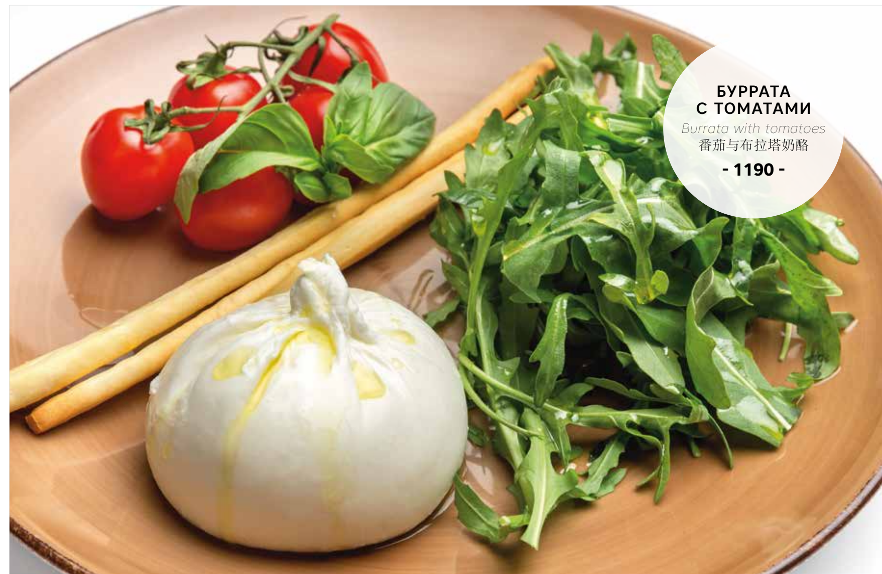
БУРРАТА С ТОМАТАМИ Burrata with tomatoes 番茄与布拉塔奶酪 - 1190 -

ПРОСЬБА ПРЕДУПРЕЖДАТЬ ВАШЕГО ОФИЦИАНТА ОБ ИМЕЮЩЕЙСЯ У ВАС АЛЛЕРГИИ НА ОПРЕДЕЛЕННЫЕ ПРОДУКТЫ ПИТАНИЯ PLEASE TELL YOUR WAITER IF YOU HAVE ANY FOOD ALLERGY | 如果您对某些饮食会产生过敏反应, 请通知您的服务员 所有价格是俄罗斯卢布价格