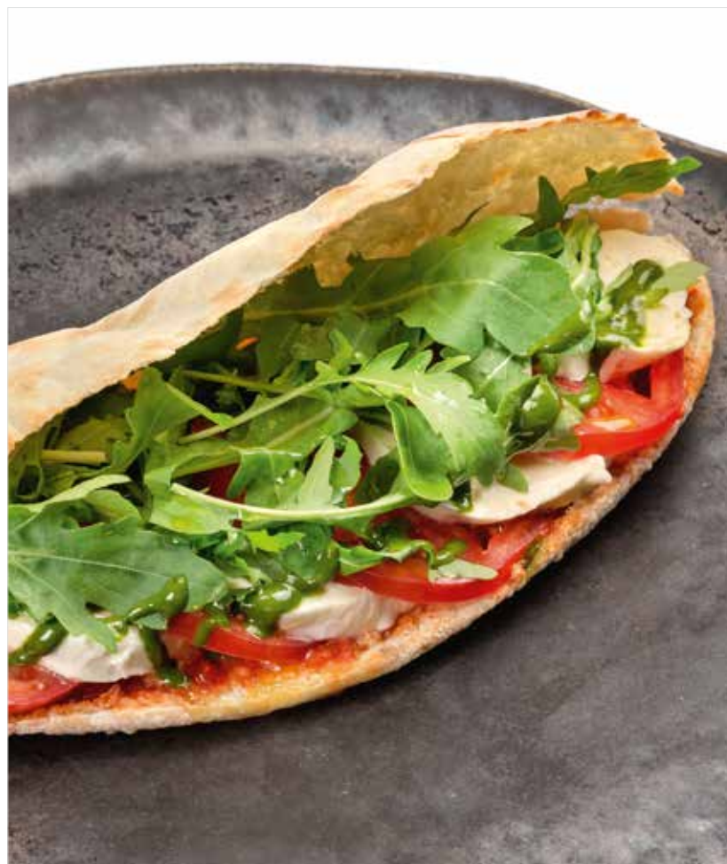
ПАНИНИ С МОЦАРЕЛЛОЙ БУФФАЛО И ТОМАТАМИ ..... 690 Panini with buffalo mozzarella and tomatoes 水牛奶酪和西红柿的帕尼诺

ПРОСЬБА ПРЕДУПРЕЖДАТЬ ВАШЕГО ОФИЦИАНТА ОБ ИМЕЮЩЕЙСЯ У ВАС АЛЛЕРГИИ НА ОПРЕДЕЛЕННЫЕ ПРОДУКТЫ ПИТАНИЯ PLEASE TELL YOUR WAITER IF YOU HAVE ANY FOOD ALLERGY | 如果您对某些饮食会产生过敏反应, 请通知您的服务员 所有价格是俄罗斯卢布价格