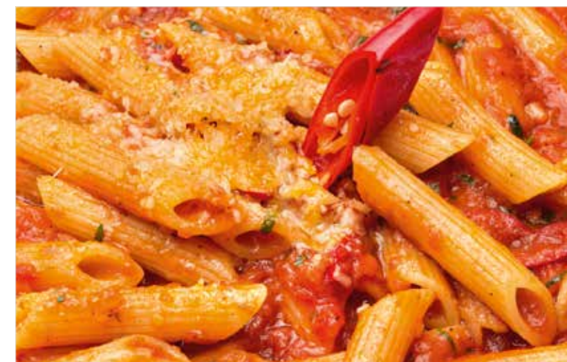
ПЕННЕ С ТОМАТНЫМ СОУСОМ И ЧИЛИ-ПЕРЦЕМ ..... 420 Penne with tomato sauce and chili pepper 直通粉, 番茄酱, 椒