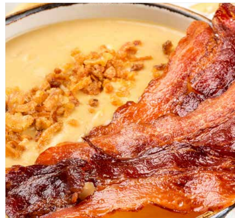
СЫРНЫЙ СУП ..... 490 Cheese soup 奶酪糖