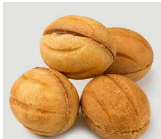
ОРЕШКИ СО СГУЩЕНКОЙ (4 шт.) ..... 190 Walnut shaped cookies with caramel (4 pcs) 炼奶坚果形饼干 (4个)