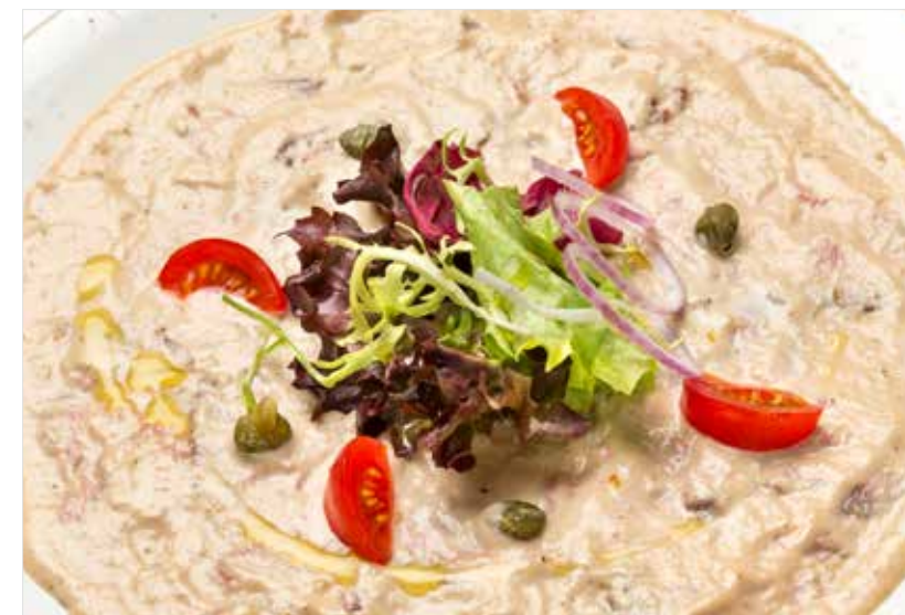
ВИТЕЛЛО ТОННАТО ..... 690 Vitello tonnato 小牛肉佐鲑鱼酱