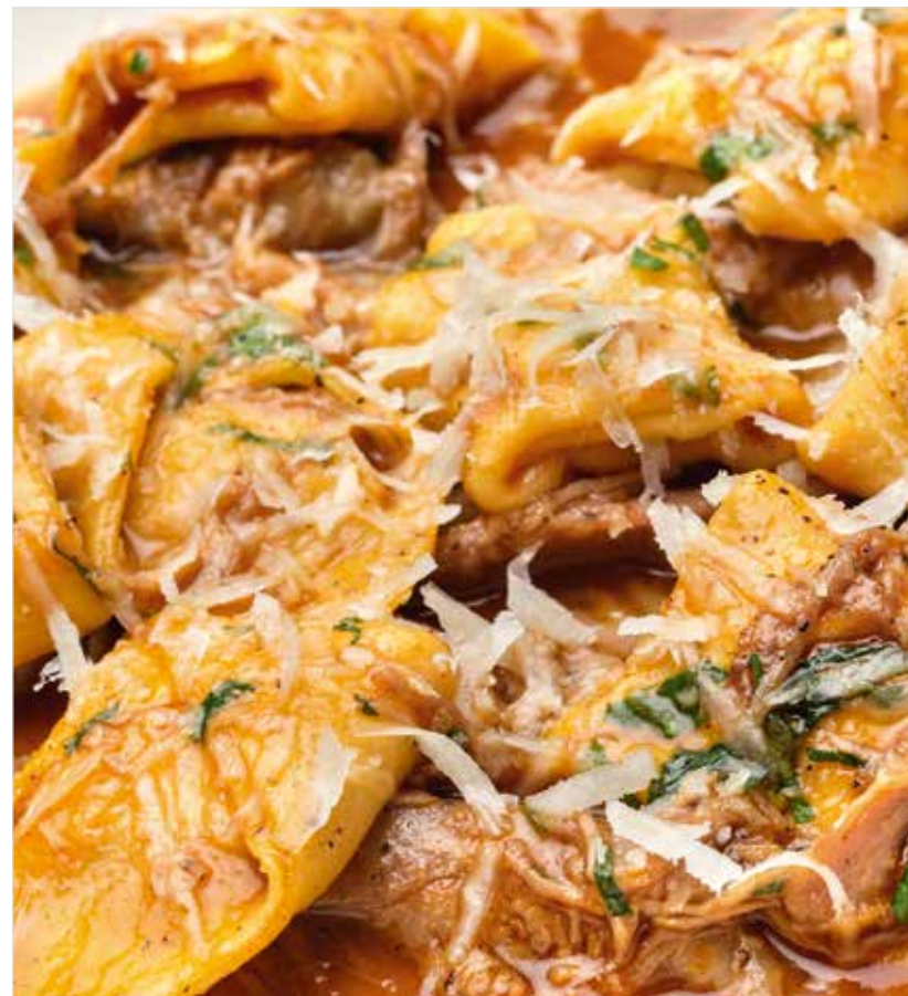
ТОРТЕЛЛИНИ С РАГУ ИЗ УТКИ И ТЫКВОЙ ..... 760 Tortellini with duck stew and pumpkin 鸭肉南瓜意大利馄饨