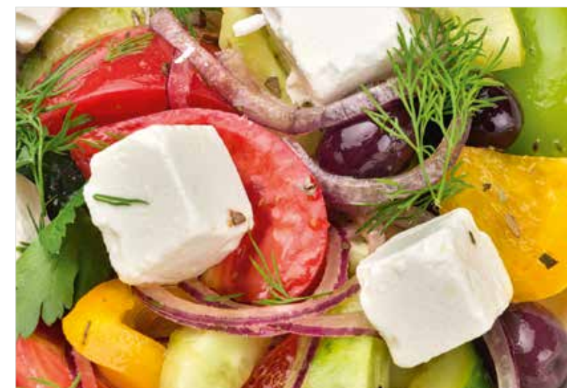
ГРЕЧЕСКИЙ Greek salad 希腊沙律