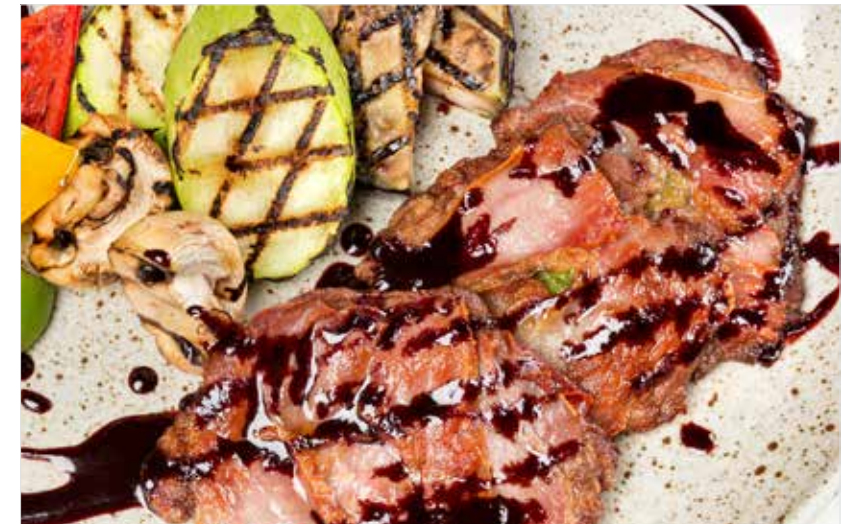
САЛЬТИМБОККА ПО-РИМСКИ С ОВОЩАМИ ГРИЛЬ

Saltimbocca "alla romana" with grilled vegetables