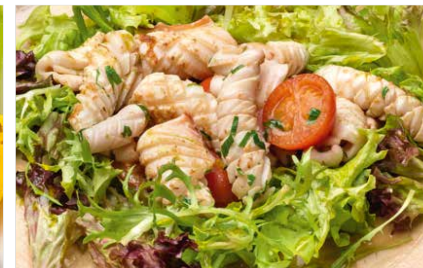
КАЛЬМАРЫ С МИКС-САЛАТОМ И ТОМАТАМИ ЧЕРРИ Squid with mixed salad and cherry tomatoes 鱿鱼混合沙拉配圣女果