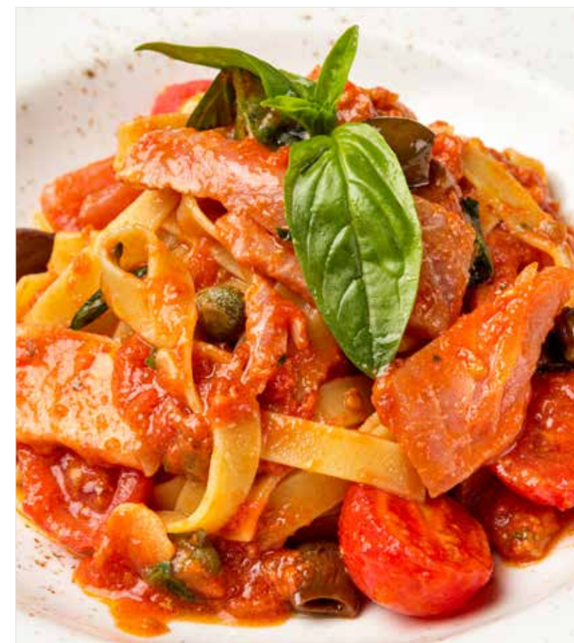
ТАЛЬЯТЕЛЛЕ С ТУНЦОМ ..... 690 Tagliatelle with tuna 金枪鱼意大利干面条