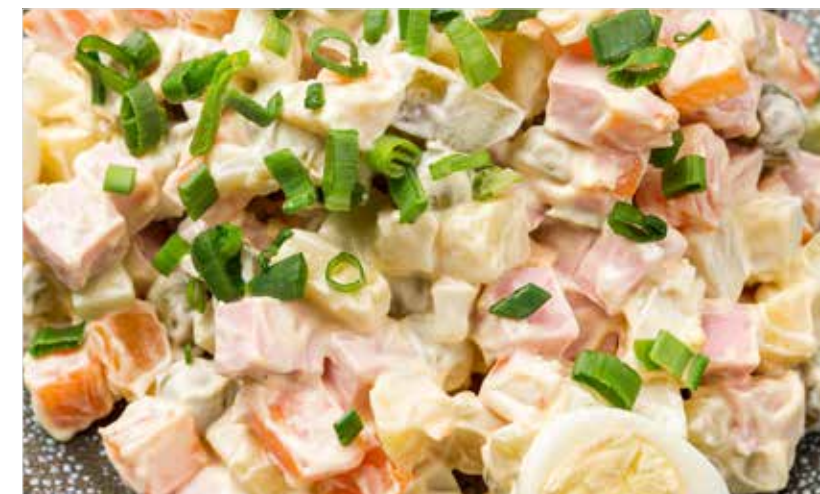
ОЛИВЬЕ ПО-ДОМАШНЕМУ С КОЛБАСОЙ / ЯЗЫКОМ Homemade Russian salad with sausage / beef tongue 家常俄式沙拉加牛舌头 / 配香肠

☞ Без глютена / Gluten free / 不含麸质 ☞ Вегетарианское / Vegetarian dish / 素食 ☞ Безлактозное / Lactose-free dish / 免乳糖