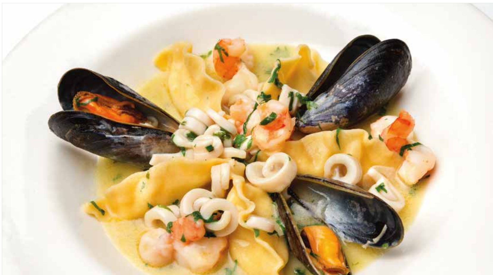
РАВИОЛИ С МОРЕПРОДУКТАМИ ..... 760 Ravioli with seafood 海鲜馄饨