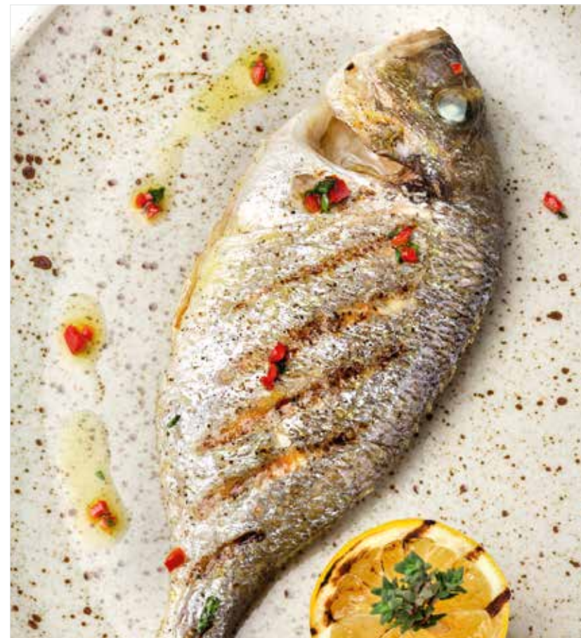
СИБАС / ДОРАДО Sea bass / Dorado 黑鲈鱼 / 麒麟