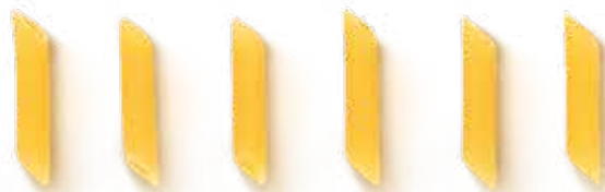
ПЕННЕ / PENNE / 直通粉