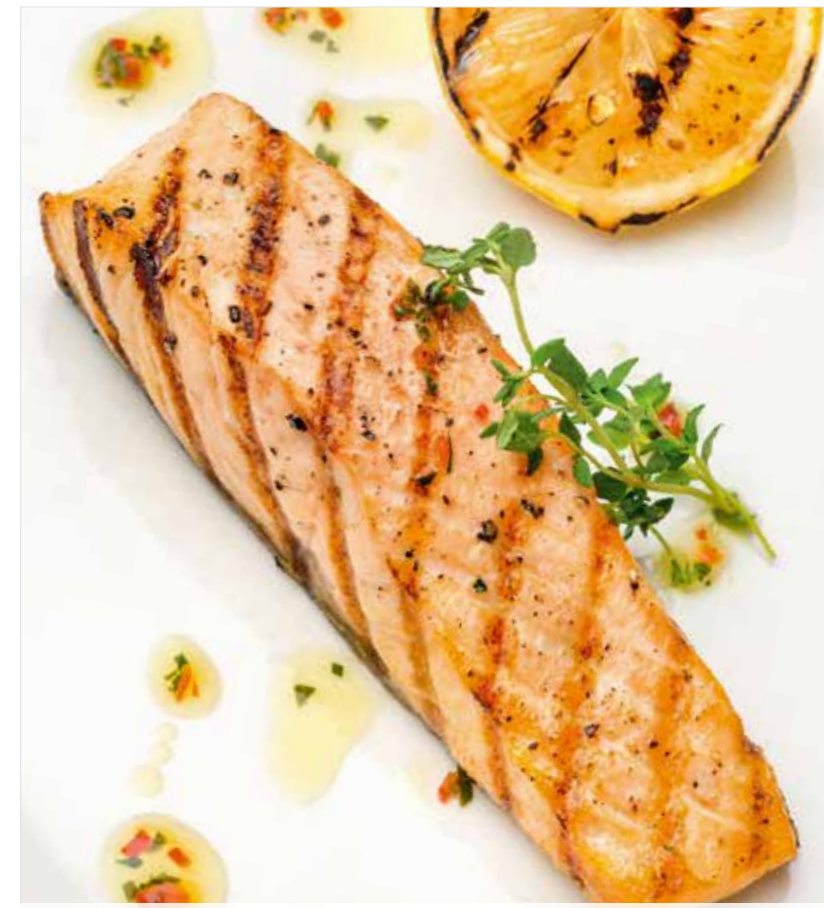
СТЕЙК ИЗ ЛОСОСЯ Salmon steak 三文鱼肉扫