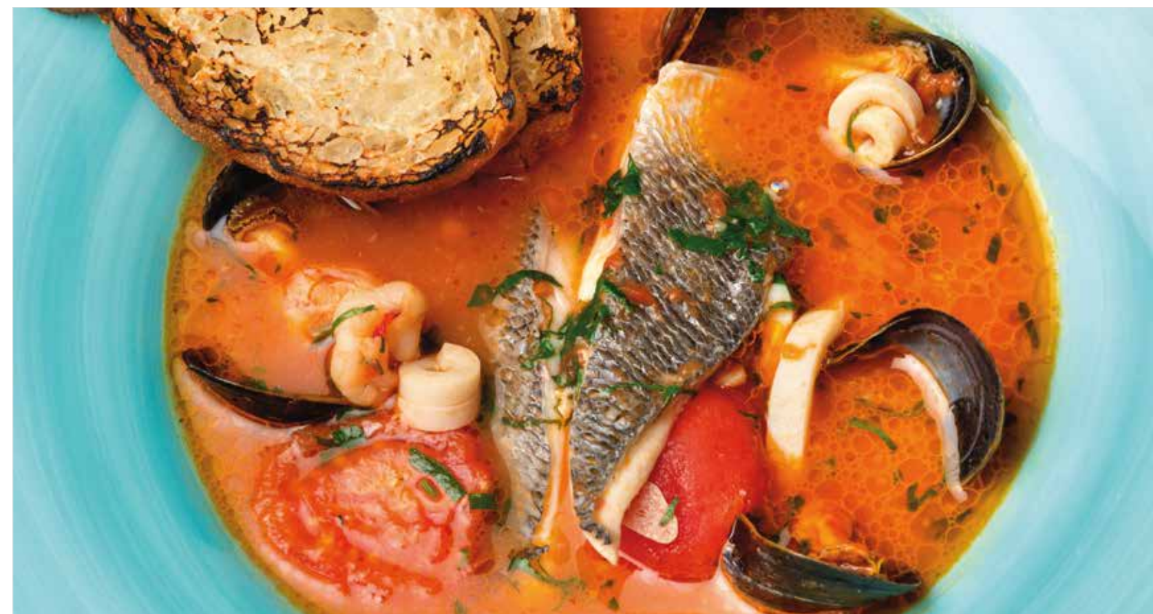
СУП С ДАРАМИ МОРЯ ..... 990 Seafood soup 海鲜汤

☞ Без глютена / Gluten free / 不含麸质 ☞ Вегетарианское / Vegetarian dish / 素食 ☞ Безлактозное / Lactose-free dish / 免乳糖