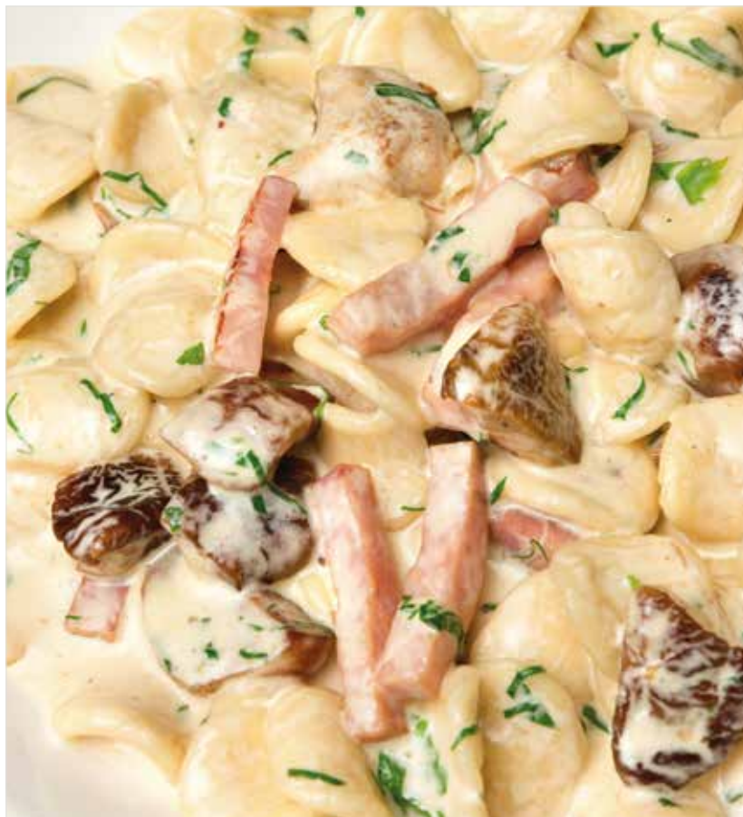
ОРЕКЬЕТТЕ С ВЕТЧИНОЙ И ГРИБАМИ ..... 620 Orecchiette with ham and mushrooms 火腿蘑菇蜆壳粉