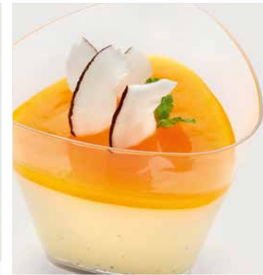
ПАНАКОТА ЭКЗОТИК ..... 290 Panna cotta exotic 异国奶冻