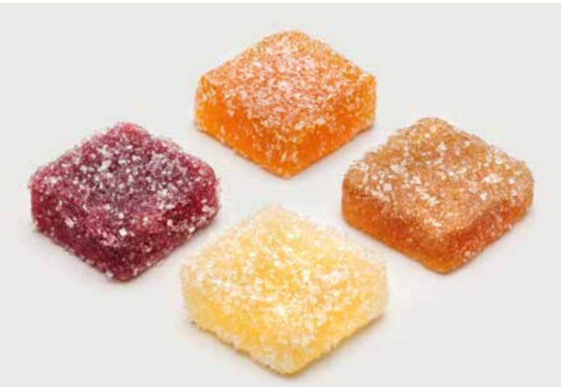
МАРМЕЛАД в ассортименте ..... 80 Marmalade in assortment 多种口味的水果软糖