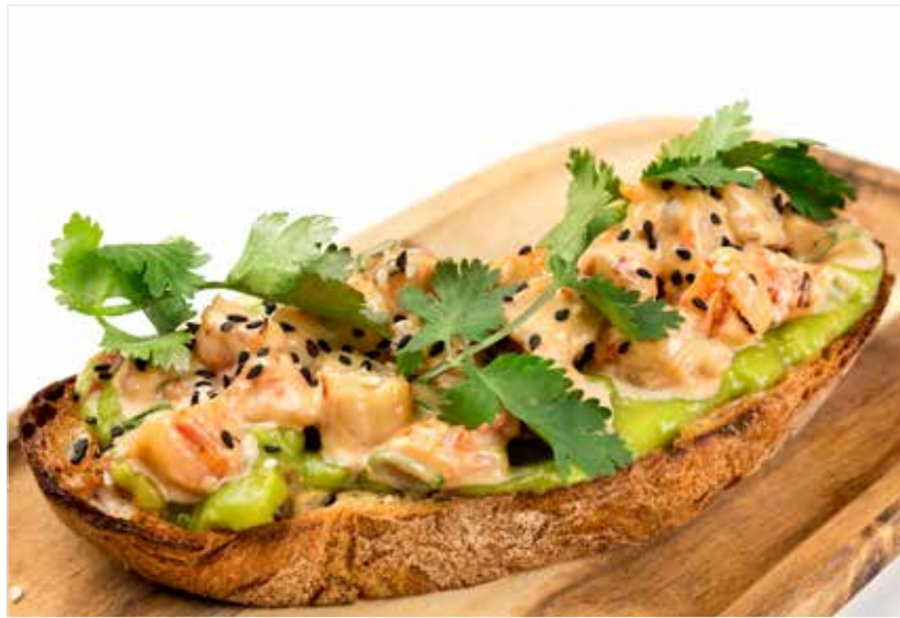
БРУСКЕТТА С КРЕВЕТКАМИ И АВОКАДО ..... 560 Bruschetta with shrimps and avocado 意式烤面包加虾和牛油果