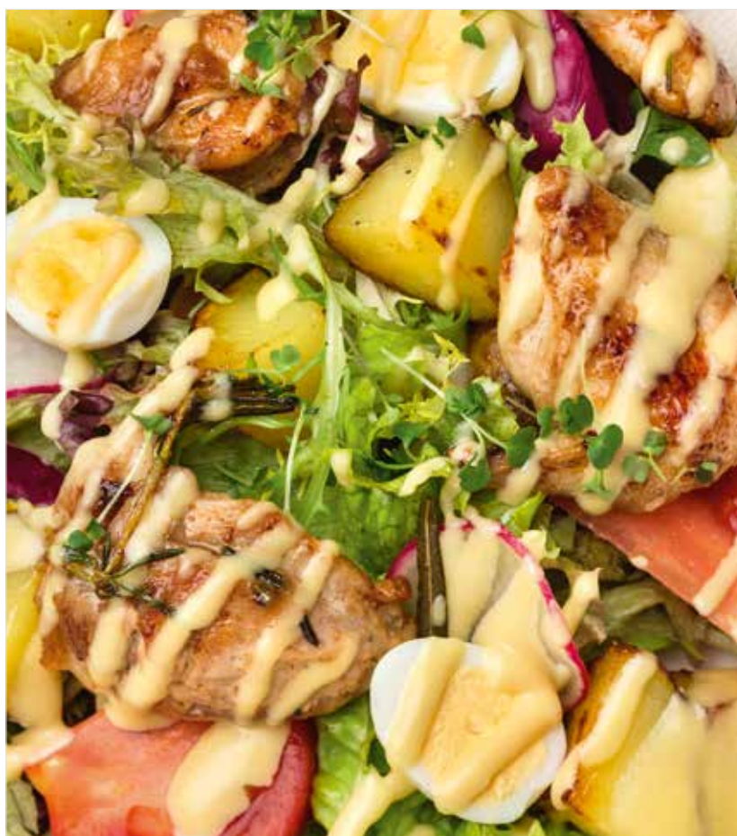
МИКС-САЛАТ С ЖАРЕНОЙ ПЕРЕПЕЛКОЙ Mixed salad with fried quail 煎鹌鹑杂菜沙律