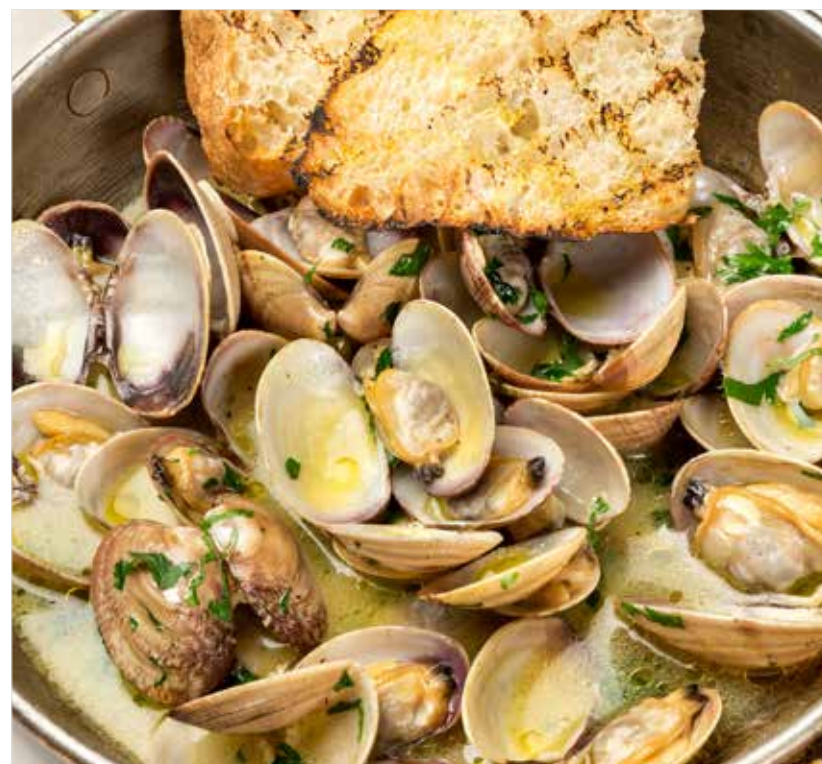
СОТЕ ИЗ ВОНГОЛЕ ..... 1490 Sauteed clam 嫩煎蛤蜊