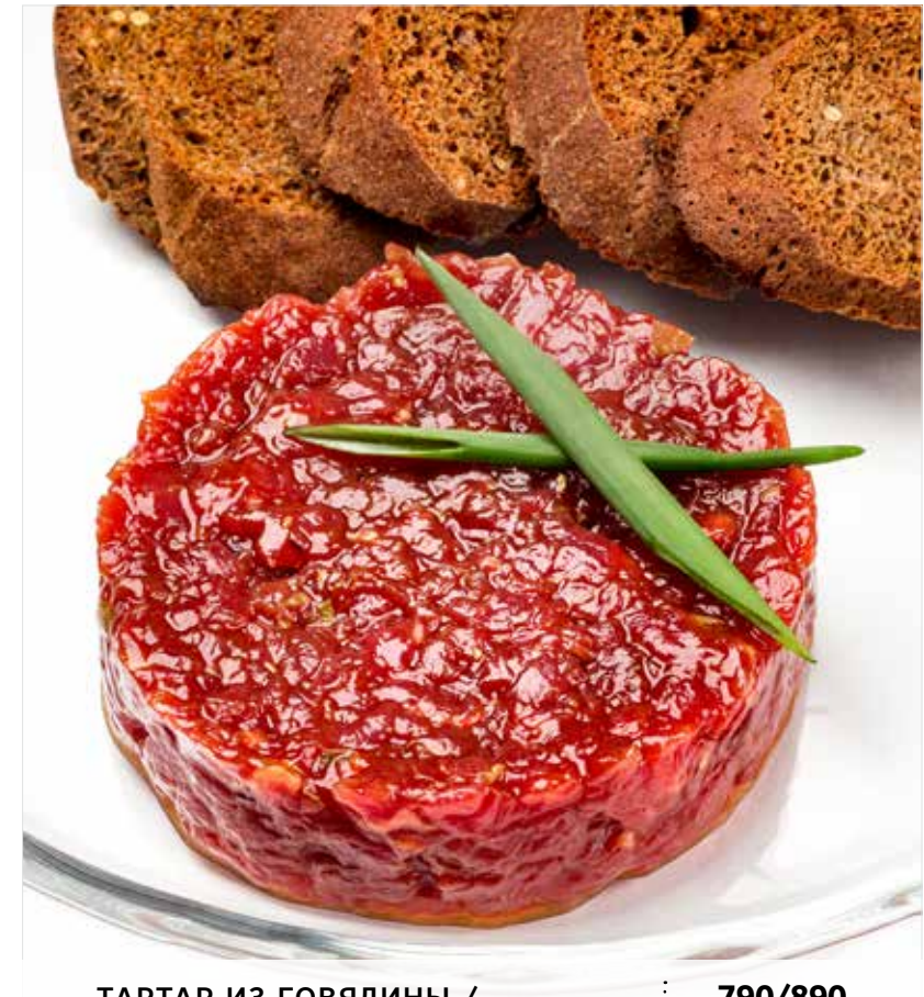
ТАРТАР ИЗ ГОВЯДИНЫ / С ТРЮФЕЛЬНОЙ ЗАПРАВКОЙ Beef tartare / with truffle seasoning 牛肉塔塔 / 松露酱