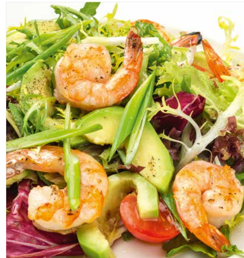
МИКС-САЛАТ С ТЕПЛЫМИ КРЕВЕТКАМИ И АВОКАДО Mixed salad with warm shrimps and avocado 温虾牛油果杂菜沙拉