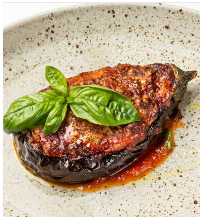
БАКЛАЖАН ПАРМИДЖАНО ..... 890 Eggplant parmigiano 帕尔马茄子

ПРОСЬБА ПРЕДУПРЕЖДАТЬ ВАШЕГО ОФИЦИАНТА ОБ ИМЕЮЩЕЙСЯ У ВАС АЛЛЕРГИИ НА ОПРЕДЕЛЕННЫЕ ПРОДУКТЫ ПИТАНИЯ PLEASE TELL YOUR WAITER IF YOU HAVE ANY FOOD ALLERGY | 如果您对某些饮食会产生过敏反应, 请通知您的服务员 所有价格是俄罗斯卢布价格