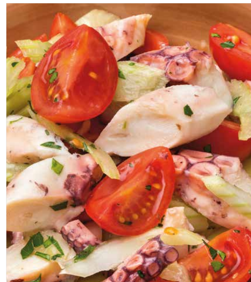
САЛАТ С ОСЬМИНОГОМ Salad with octopus 八爪鱼沙律