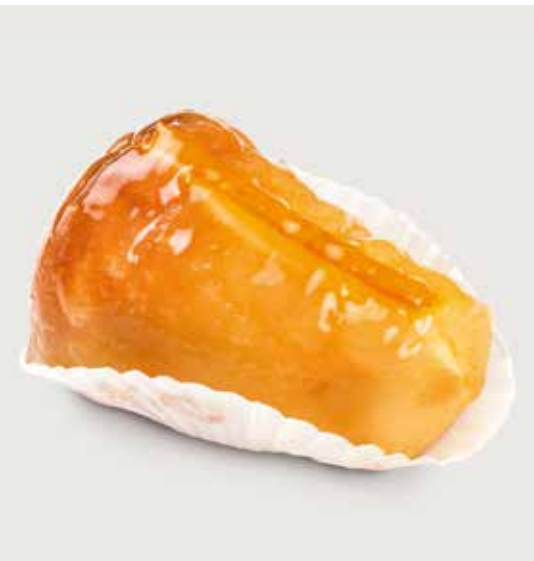
РОМОВАЯ БАБА ..... 120 Rum cake 朗姆酒蛋糕