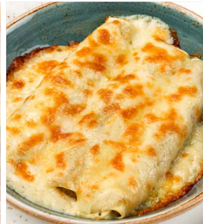
КАННЕЛЛОНИ, ФАРШИРОВАННЫЕ УТКОЙ ..... 720 Cannelloni stuffed with duck 意大利鸭肉馅卷