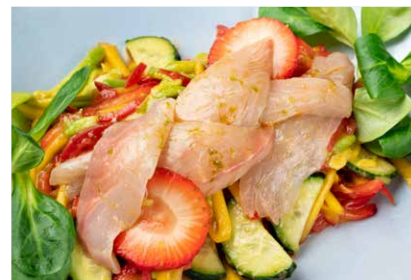
САЛАТ С ДОРАДО, МАНГО И КЛУБНИКОЙ Salad with dorado, mango and strawberry 金头鲷芒果草莓沙拉