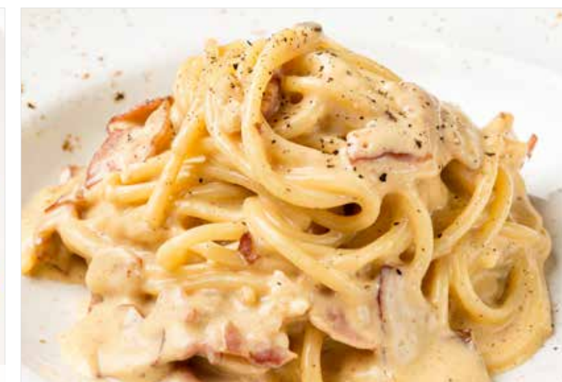
«КАРБОНАРА» ..... 590 Carbonara 培根蛋面

ПРОСЬБА ПРЕДУПРЕЖДАТЬ ВАШЕГО ОФИЦИАНТА ОБ ИМЕЮЩЕЙСЯ У ВАС АЛЛЕРГИИ НА ОПРЕДЕЛЕННЫЕ ПРОДУКТЫ ПИТАНИЯ PLEASE TELL YOUR WAITER IF YOU HAVE ANY FOOD ALLERGY | 如果您对某些饮食会产生过敏反应, 请通知您的服务员 所有价格是俄罗斯卢布价格