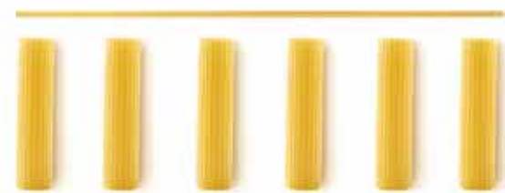
РИГАТОНИ / RIGATONI / 长通粉