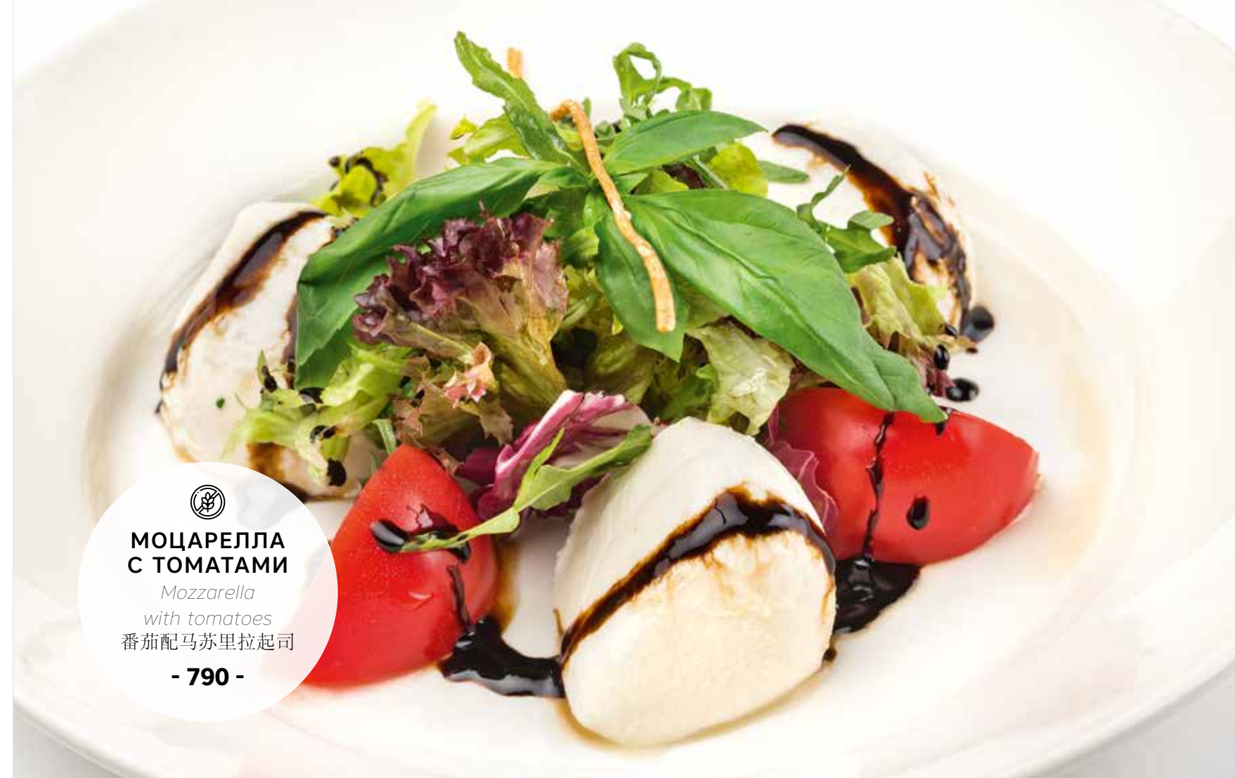
МОЦАРЕЛЛА С ТОМАТАМИ Mozzarella with tomatoes 番茄配马苏里拉起司 - 790 -