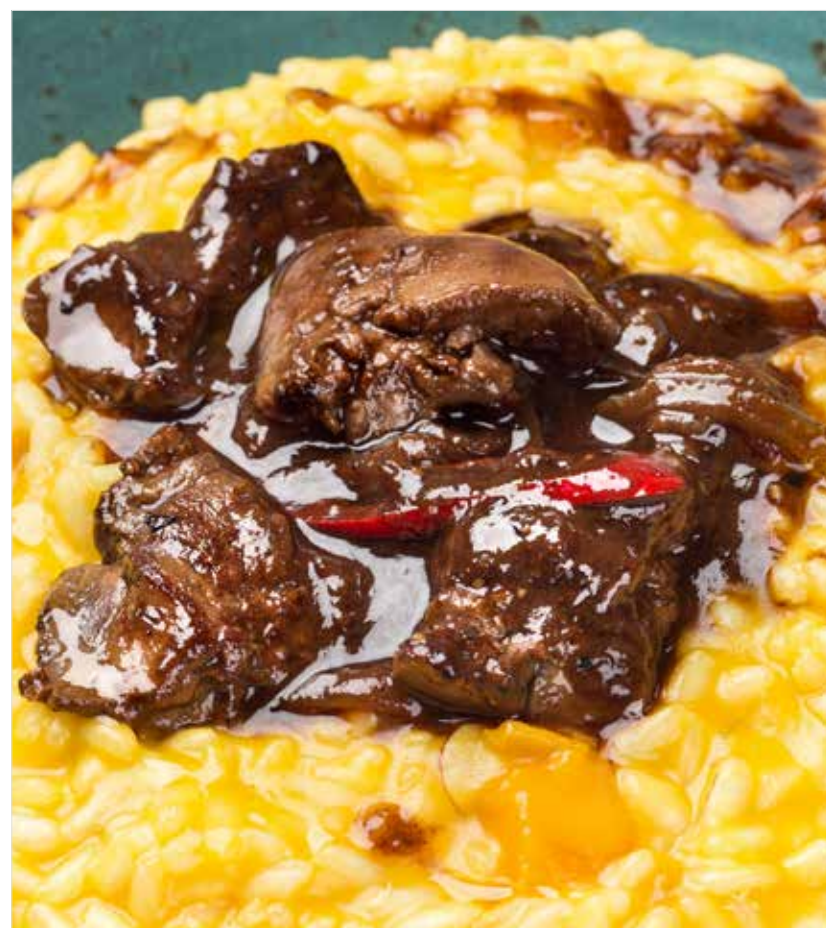
РИЗОТТО С ТЫКВОЙ И ПЕЧЕНЬЮ КРОЛИКА

Risotto with pumpkin and rabbit liver 兔子肝南瓜意大利炖饭