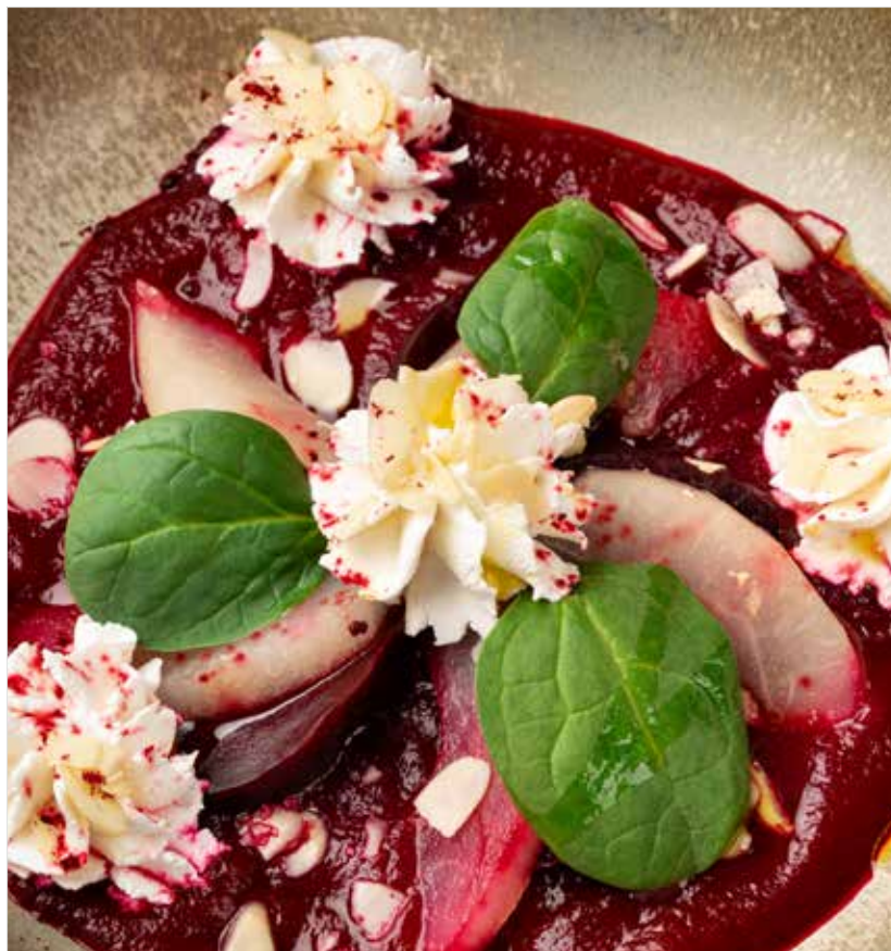
САЛАТ СО СВЕКЛОЙ, КОЗЬИМ СЫРОМ И КОНСЕРВИРОВАННОЙ ГРУШЕЙ Beet, goat cheese and soused pear salad 甜菜山羊奶酪渍梨沙拉