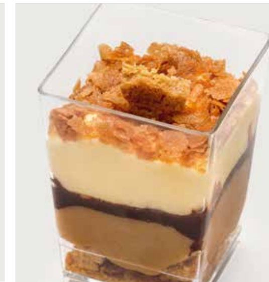
ФУНДУЧНОЕ ПРАЛИНЕ ..... 260 Hazelnut praline 果仁糖