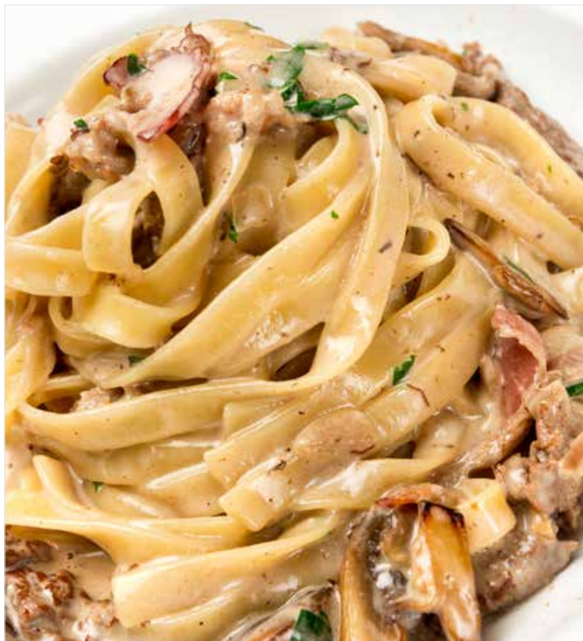
ТАЛЬЯТЕЛЛЕ С РАГУ ИЗ ГОВЯДИНЫ ..... 760 Tagliatelle with stewed beef 炖牛肉意大利面