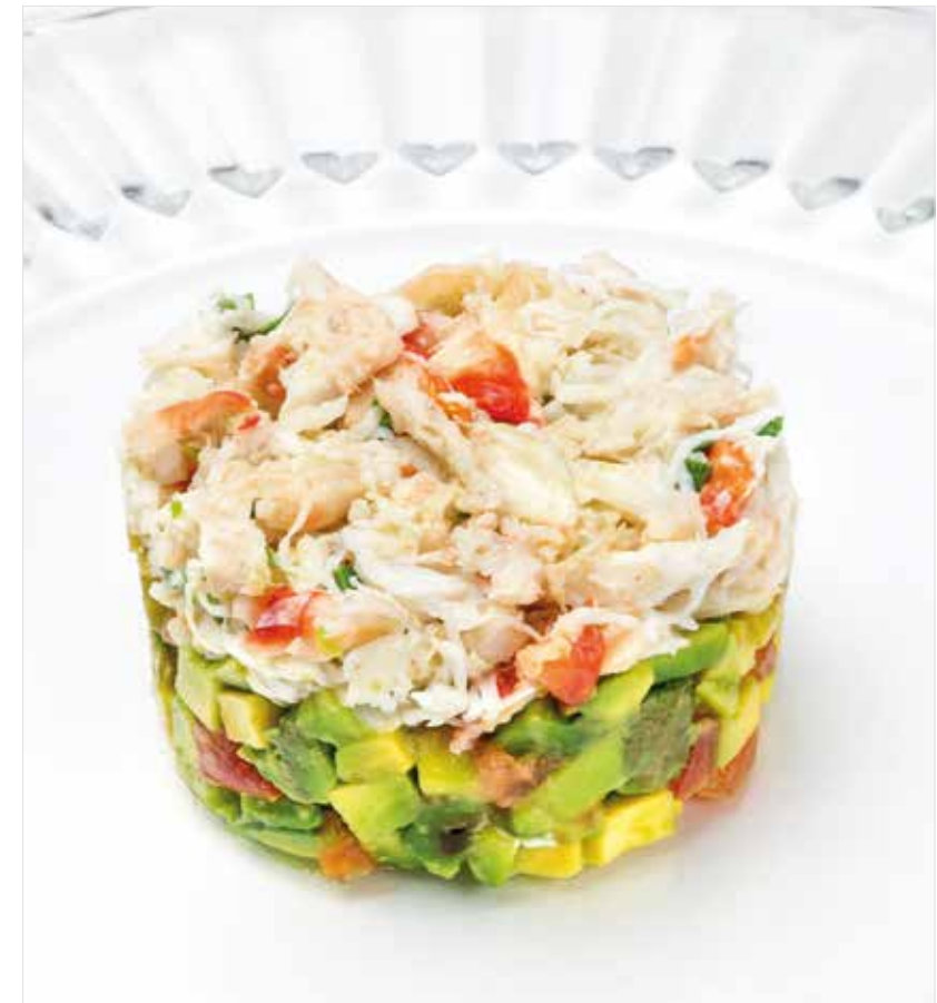
ТАРТАР ИЗ КРАБА Crab tartare 蟹肉塔塔