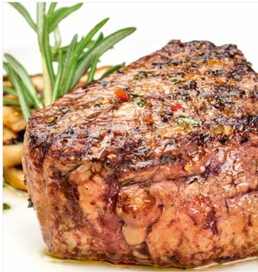
ФИЛЕ (МРАМОРНАЯ ГОВЯДИНА) С ПЕРЕЧНЫМ СОУСОМ Marbled beef fillet with pepper sauce 五花牛肉片加胡椒酱