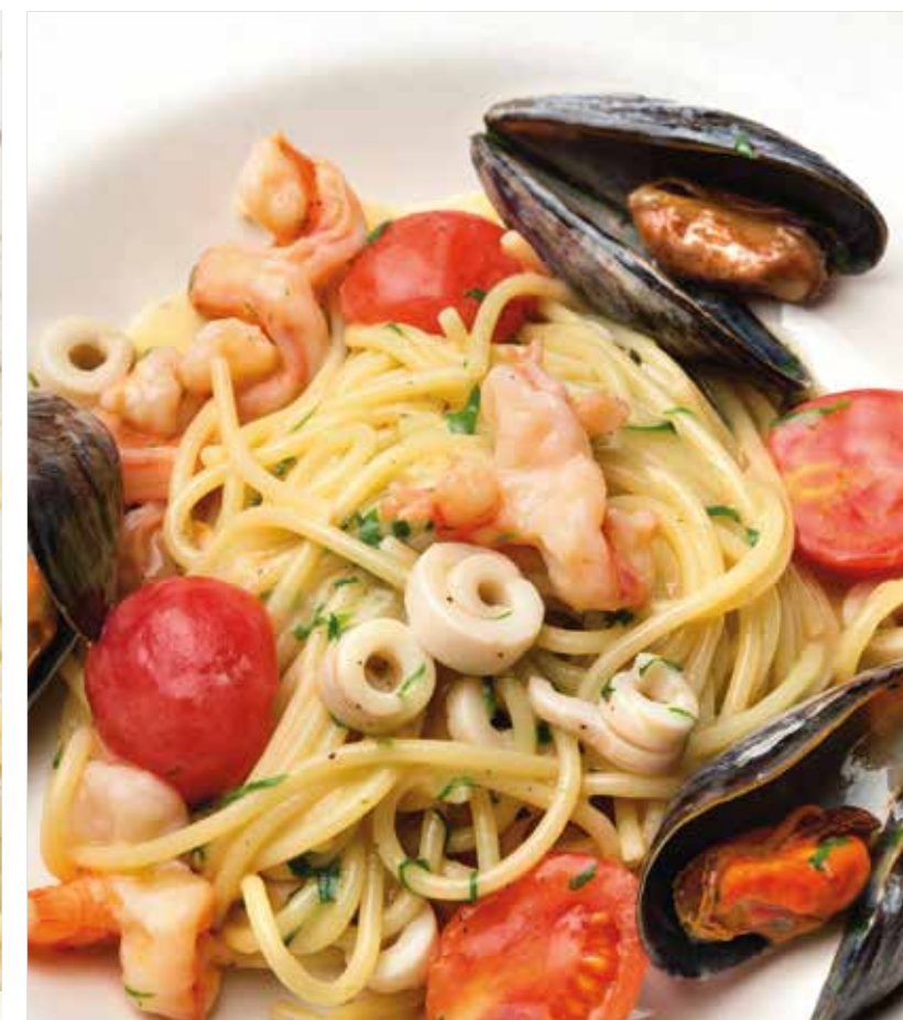
СПАГЕТТИ С МОРЕПРОДУКТАМИ ..... 990 Spaghetti with seafood 海鲜意大利粉

ПРОСЬБА ПРЕДУПРЕЖДАТЬ ВАШЕГО ОФИЦИАНТА ОБ ИМЕЮЩЕЙСЯ У ВАС АЛЛЕРГИИ НА ОПРЕДЕЛЕННЫЕ ПРОДУКТЫ ПИТАНИЯ PLEASE TELL YOUR WAITER IF YOU HAVE ANY FOOD ALLERGY | 如果您对某些饮食会产生过敏反应, 请通知您的服务员 所有价格是俄罗斯卢布价格