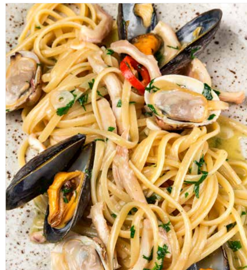
ЛИНГВИНИ С МОЛЛЮСКАМИ, КАЛЬМАРОМ И КРЕВЕТКАМИ ..... 990 Linguine with clams, squid and shrimps 蛤蜊鱿鱼鲜虾中细面