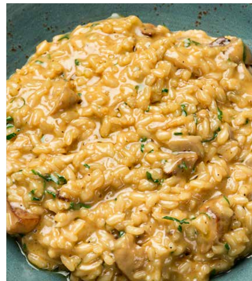
РИЗОТТО С ГРИБАМИ