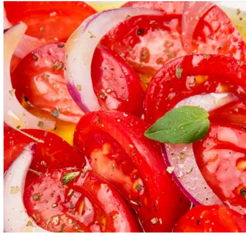
КАРПАЧЧО ИЗ ПОМИДОРОВ Tomato carpaccio 番茄薄片