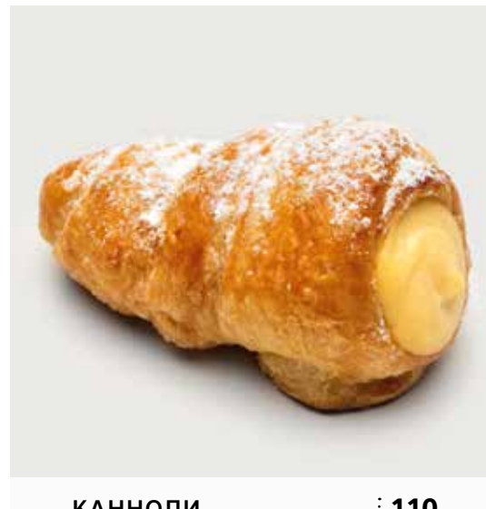
КАННОЛИ С ЗАВАРНЫМ КРЕМОМ ..... 110 Cannoli with custard 奶油甜馅酥皮卷