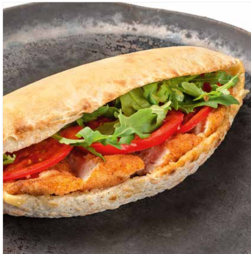
ПАНИНИ С КУРИНЫМ ФИЛЕ И ТОМАТАМИ ..... 690 Panini with chicken fillet and tomatoes 鸡肉片和西红柿的帕尼诺(热三明治)