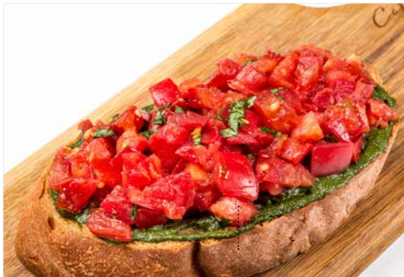
БРУСКЕТТА С ТОМАТАМИ И СОУСОМ ПЕСТО ..... 460 Bruschetta with tomatoes and pesto sauce 意式多士配意大利香蒜青酱