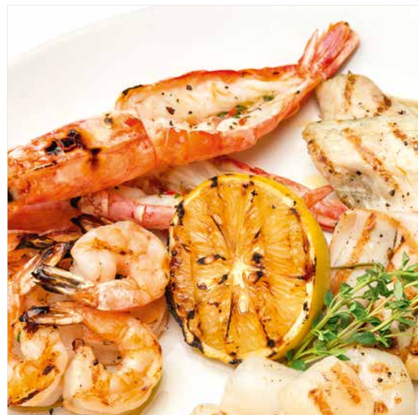
АССОРТИ ИЗ МОРЕПРОДУКТОВ (филе сибаса, кальмары, гребешки, креветки) Assorted seafood (sea bass fillet, calamari, scallop, shrimps) 什锦海鲜 (黑鲈片, 鱿鱼, 扇贝, 虾)