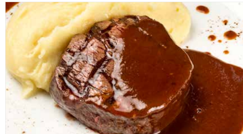
МЕДАЛЬОНЫ ИЗ ГОВЯДИНЫ С КАРТОФЕЛЬНЫМ ПЮРЕ И ТРЮФЕЛЬНЫМ СОУСОМ

Beef medallions and mashed potatoes with truffle sauce