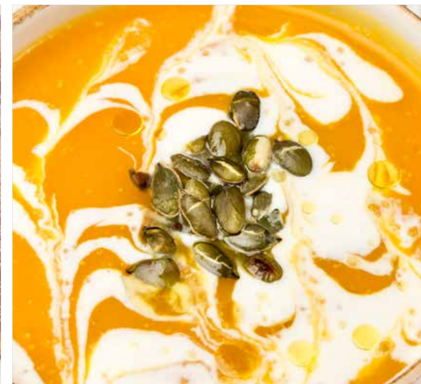
ТЫКВЕННЫЙ СУП С РИКОТТОЙ ..... 460 Pumpkin soup with ricotta 利可塔奶酪