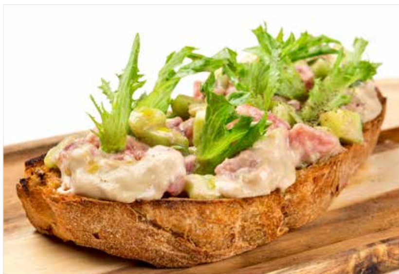
БРУСКЕТТА С ТУНЦОМ ..... 690 Bruschetta with tuna 意式烤面包加金枪鱼