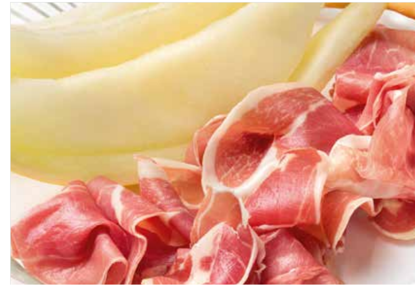
ПАРМСКАЯ ВЕТЧИНА С ДЫНЕЙ ..... 990 Prosciutto di Parma with melon 帕尔马火腿加香瓜