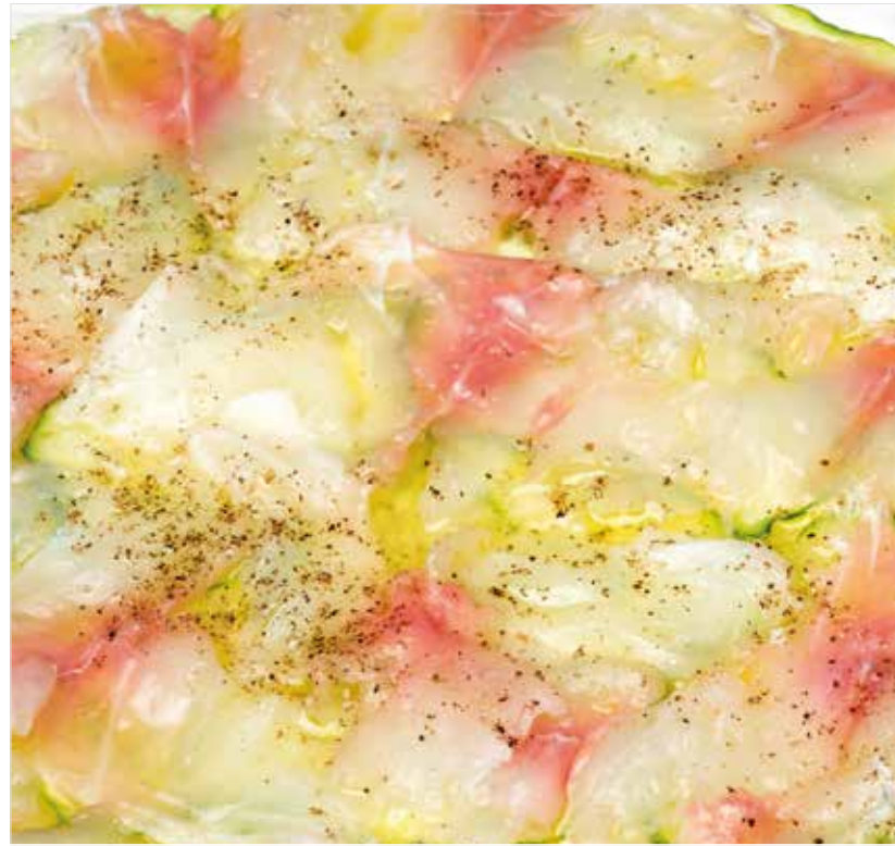
КАРПАЧЧО ИЗ ДОРАДО Dorado carpaccio 鲱鳅薄片