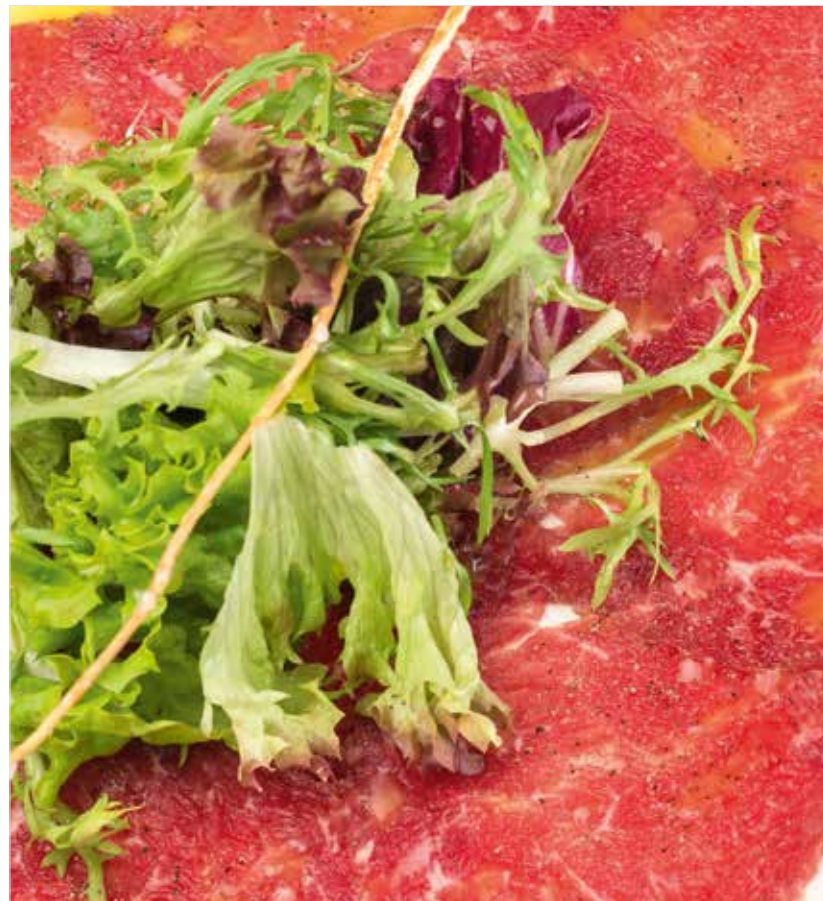
КАРПАЧЧО ИЗ ГОВЯДИНЫ / С ТРЮФЕЛЬНЫМ КРЕМОМ Beef carpaccio / with truffle cream 牛肉薄片 / 松露奶油