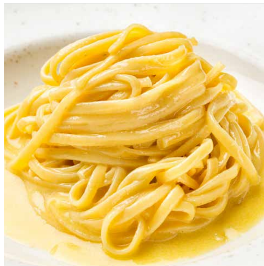
ДОМАШНИЕ ТАЛЬОЛИНИ С ПАРМЕЗАНОМ ..... 540 Homemade tagliolini with parmesan 家常意式干面加帕马森奶酪