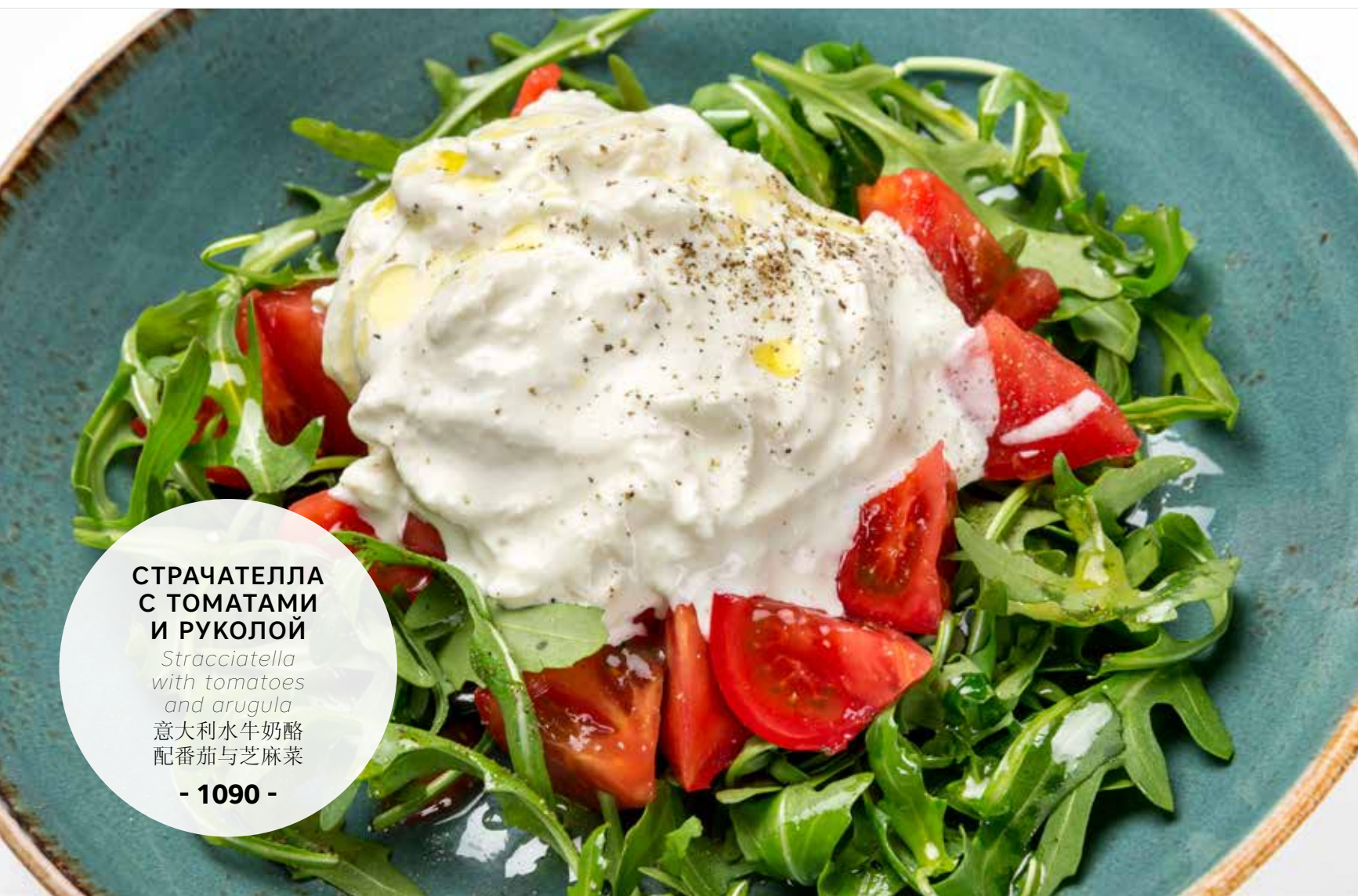
СТРАЧАТЕЛЛА С ТОМАТАМИ И РУКОЛОЙ Stracciatella with tomatoes and arugula 意大利水牛奶酪 配番茄与芝麻菜 - 1090 -