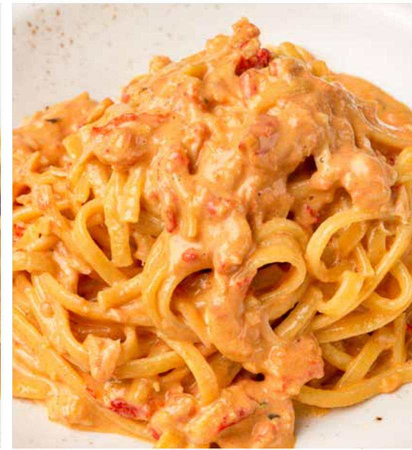
ТАЛЬОЛИНИ С КРАБОМ ..... 1390 Tagliolini with crab 螃蟹意大利面