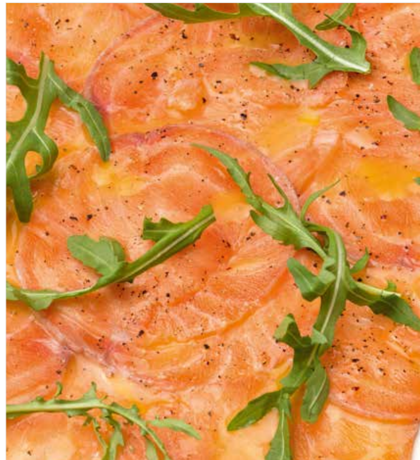
КАРПАЧЧО ИЗ ЛОСОСЯ Salmon carpaccio 三文鱼薄片