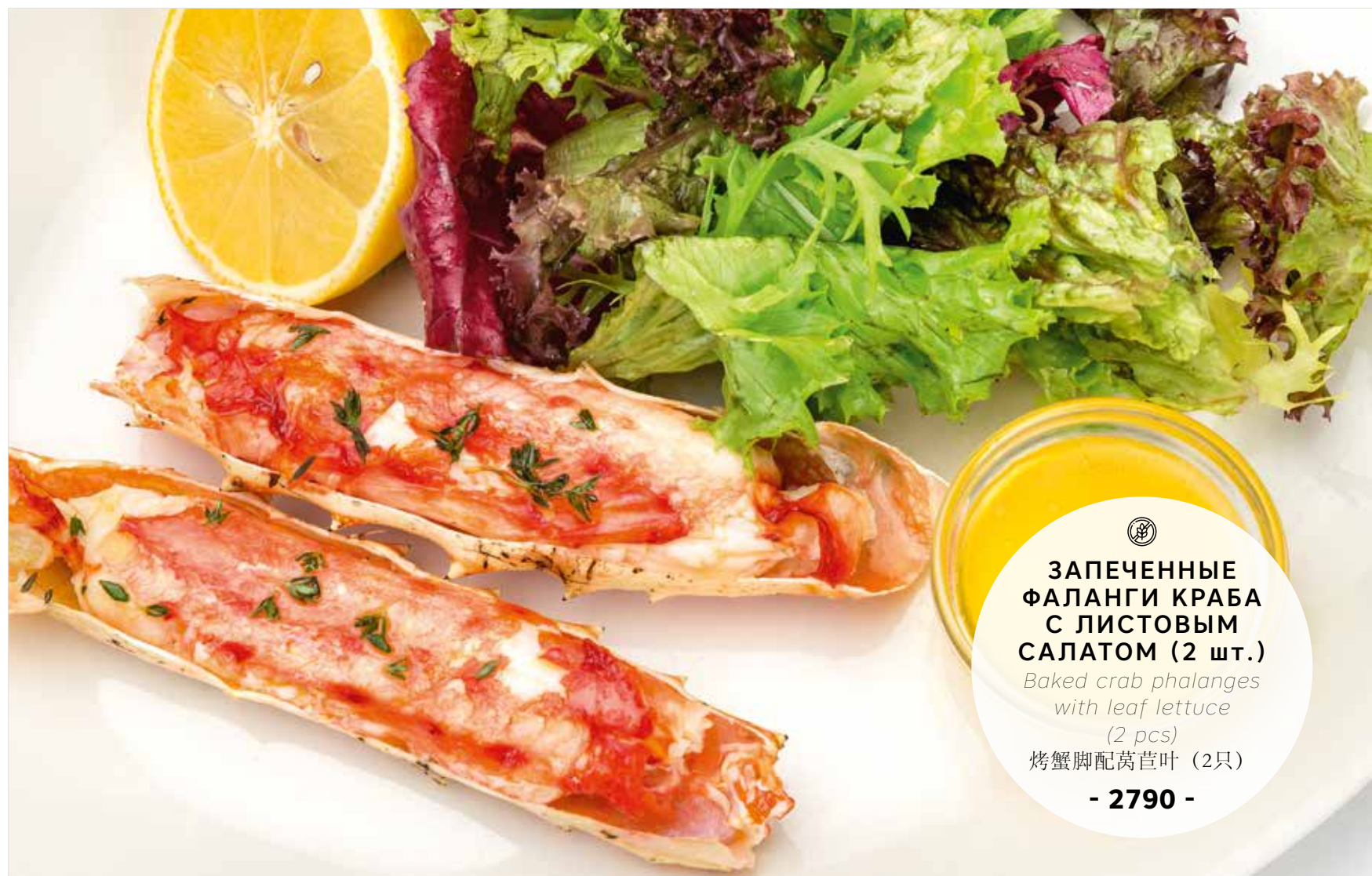
ЗАПЕЧЕННЫЕ ФАЛАНГИ КРАБА С ЛИСТОВЫМ САЛАТОМ (2 шт.) Baked crab phalanges with leaf lettuce (2 pcs) 烤蟹脚配莴苣叶 (2只) - 2790 -