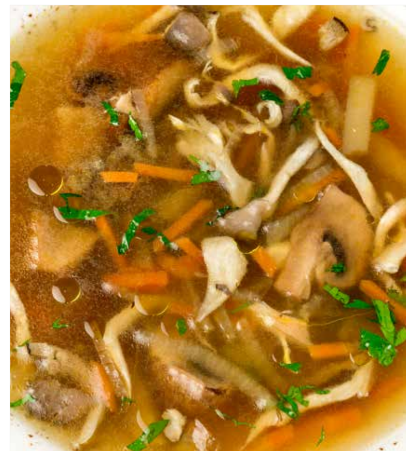
ГРИБНОЙ СУП СО СМЕТАНОЙ Sour cream mushroom soup 蘑菇汤与酸奶油