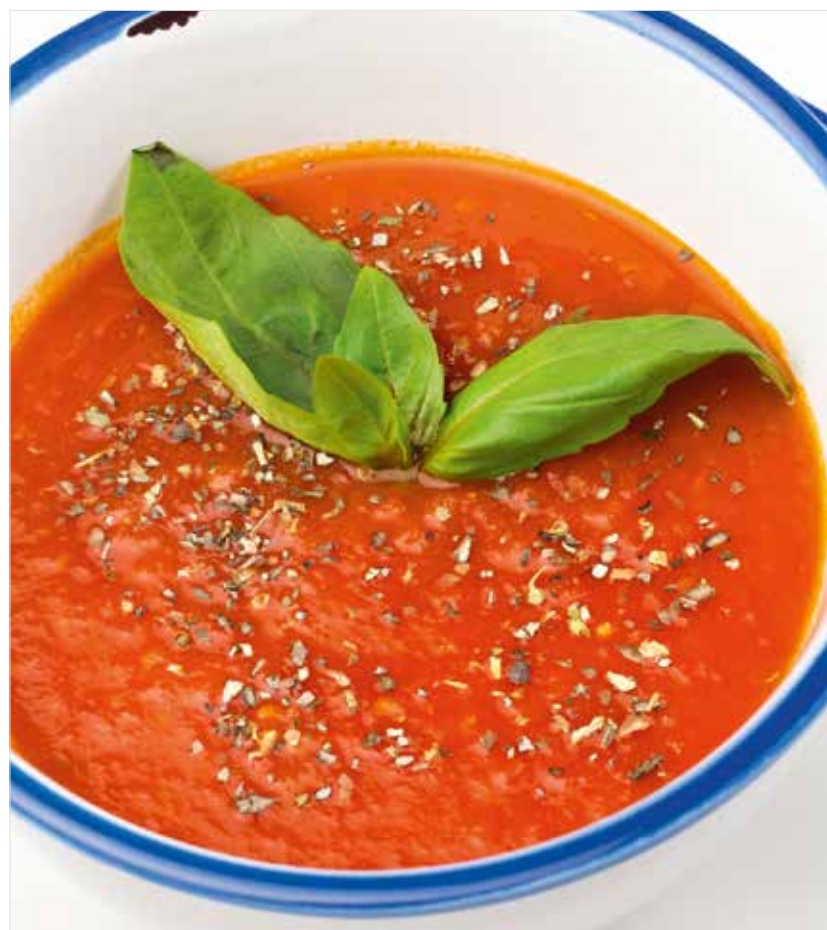
ТОМАТНЫЙ СУП Tomato soup 番茄汤