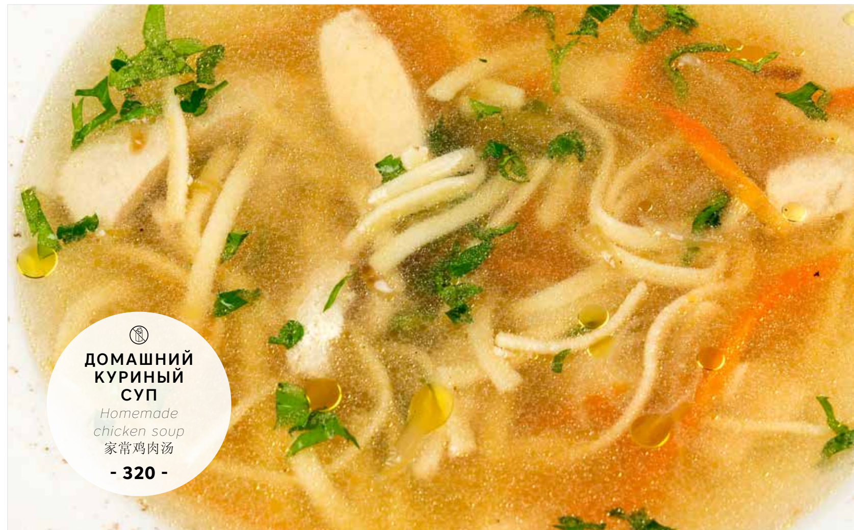
ДОМАШНИЙ КУРИНЫЙ СУП Homemade chicken soup 家常鸡肉汤 - 320 -