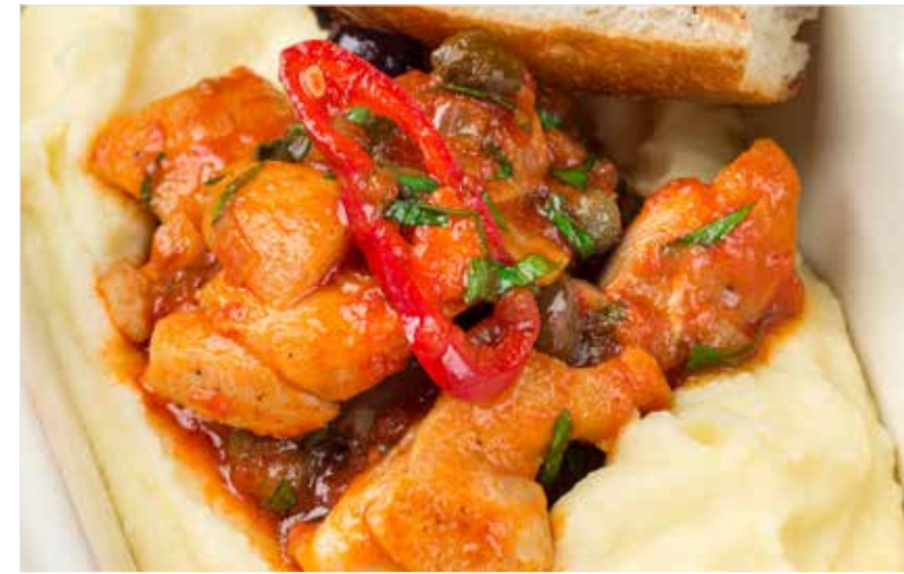
БЕДРО ЦЫПЛЕНКА, ТУШЕННОЕ С ОЛИВКАМИ И ТОМАТАМИ

Chicken thigh stewed with olives and tomatoes