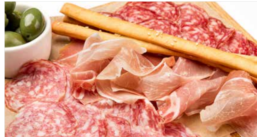
АССОРТИ ИЗ МЯСНЫХ ДЕЛИКАТЕСОВ (салами, пармская ветчина, салами с трюфелем) ..... 990 Assorted meat delicacies (salami, parma ham, salami with truffle) 肉类美食 (萨拉米香肠, 帕尔玛火腿, 松露意大利腊肠)