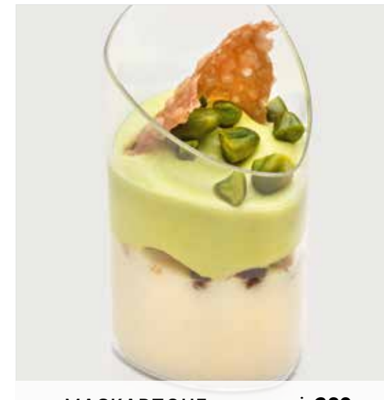
МАСКАРПОНЕ С КРЕМОМ ..... 260 Mascarpone with cream 马斯卡邦尼奶酪配奶油