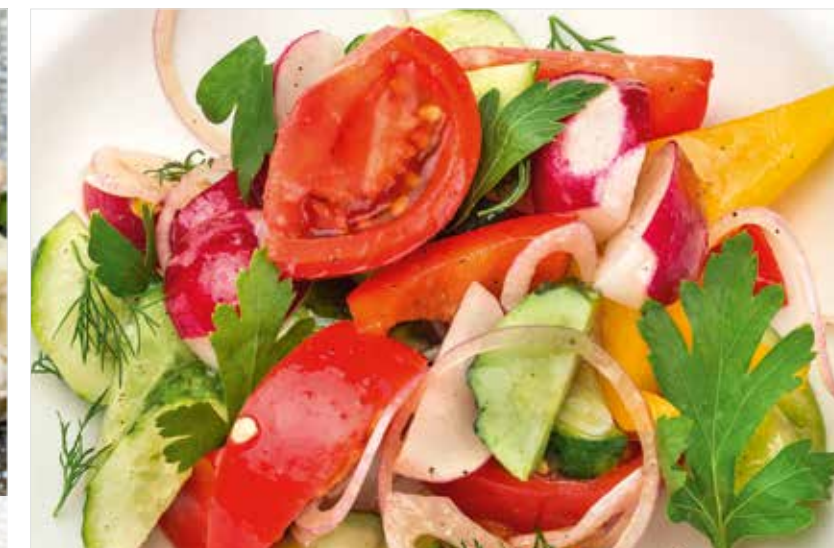
ОВОЩНОЙ САЛАТ Vegetable salad 蔬菜沙拉