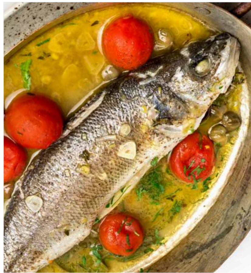
СИБАС / ДОРАДО «АКВА ПАЦЦА» ..... 1190 Sea bass / dorado "acqua pazza" 意大利式煮欧洲鲈 / 鲷