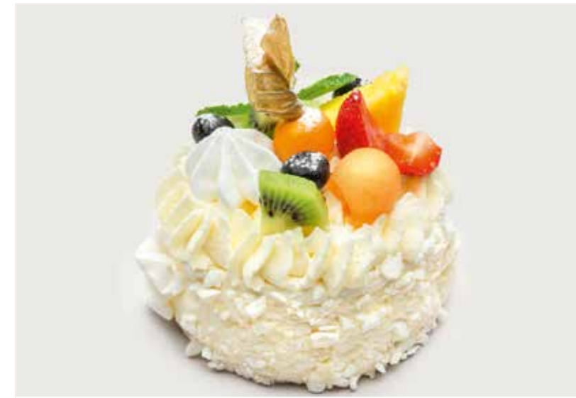
МЕРЕНГАТА С ФРУКТАМИ ..... 280 Meringata with fruits 蛋白霜蛋糕