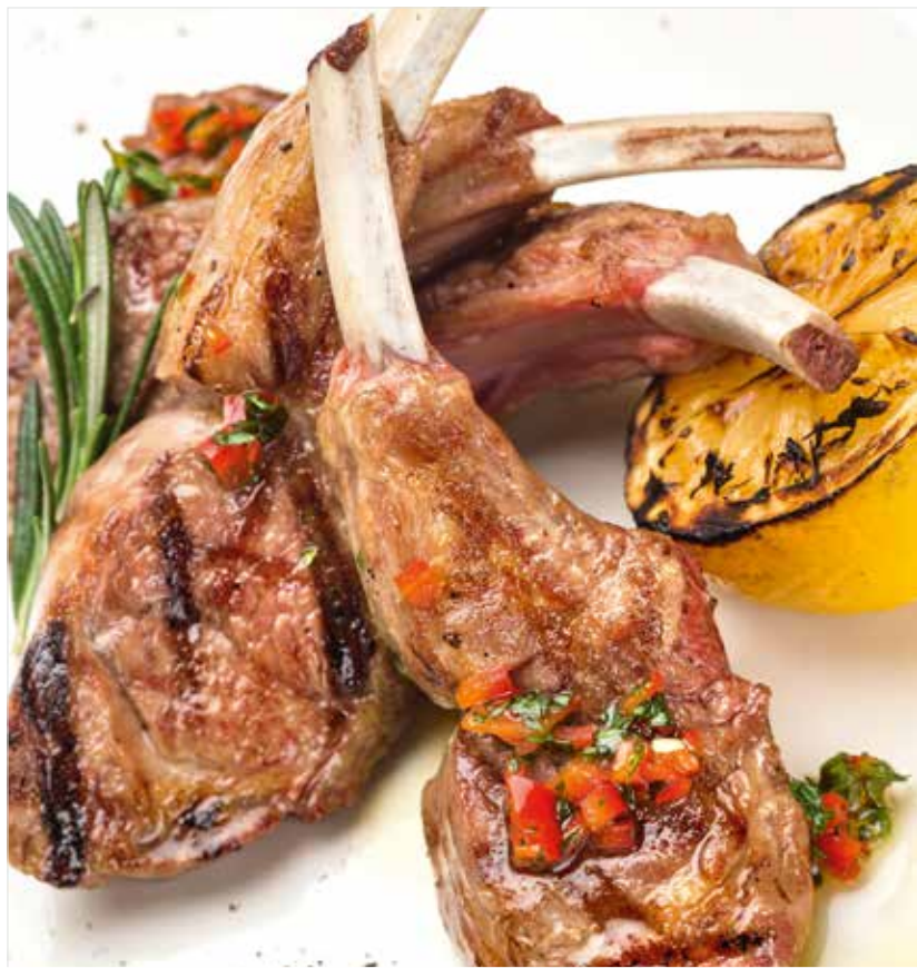
РЕБРЫШКИ ЯГНЕНКА С ГРАНАТОВЫМ СОУСОМ Lamb ribs with pomegranate sauce 羊羔排骨加石榴酱