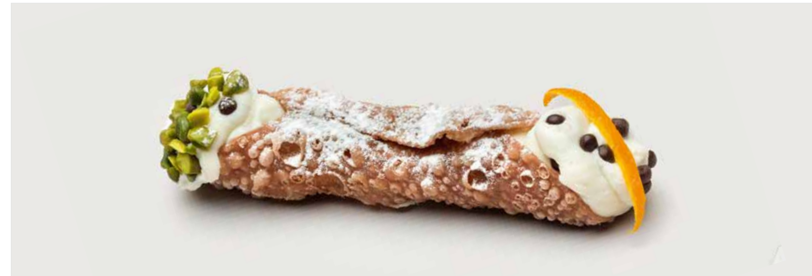
КАННОЛИ СИЧИЛИАНО ..... 340 Cannoli siciliani 西西里小酥皮卷

ПРОСЬБА ПРЕДУПРЕЖДАТЬ ВАШЕГО ОФИЦИАНТА ОБ ИМЕЮЩЕЙСЯ У ВАС АЛЛЕРГИИ НА ОПРЕДЕЛЕННЫЕ ПРОДУКТЫ ПИТАНИЯ PLEASE TELL YOUR WAITER IF YOU HAVE ANY FOOD ALLERGY | 如果您对某些饮食会产生过敏反应, 请通知您的服务员 所有价格是俄罗斯卢布价格