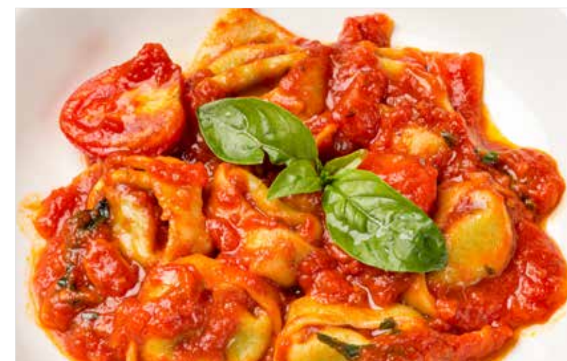
ТОРТЕЛЛИ С РИКОТТОЙ И ШПИНАТОМ В ТОМАТНОМ СОУСЕ ..... 540 Tortelli with ricotta and spinach in tomato sauce 利可塔奶酪与菠菜意大利饺子加番茄酱