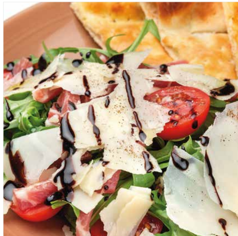
САЛАТ С ПАРМСКОЙ ВЕТЧИНОЙ, ТОМАТАМИ ЧЕРРИ, ПАРМЕЗАНОМ И РУКОЛОЙ Salad with prosciutto di Parma, cherry tomatoes, parmesan and arugula 帕尔玛火腿、圣女果、帕尔玛奶酪、芝麻菜沙拉