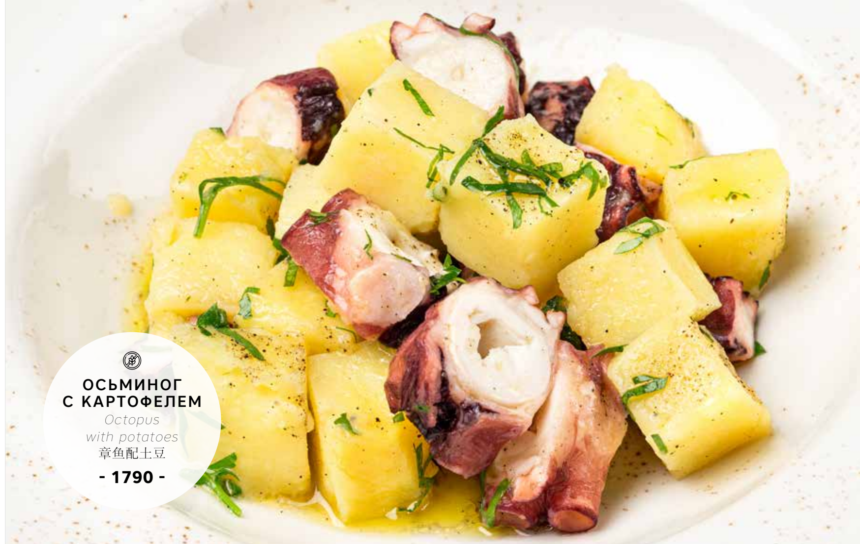
ОСЬМИНОГ С КАРТОФЕЛЕМ Octopus with potatoes 章鱼配土豆 - 1790 -

ПРОСЬБА ПРЕДУПРЕЖДАТЬ ВАШЕГО ОФИЦИАНТА ОБ ИМЕЮЩЕЙСЯ У ВАС АЛЛЕРГИИ НА ОПРЕДЕЛЕННЫЕ ПРОДУКТЫ ПИТАНИЯ PLEASE TELL YOUR WAITER IF YOU HAVE ANY FOOD ALLERGY | 如果您对某些饮食会产生过敏反应, 请通知您的服务员 所有价格是俄罗斯卢布价格