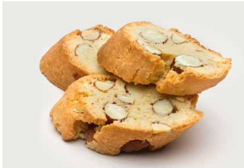
ПЕЧЕНЬЕ «КАНТУЧЧИ» ..... 120 Cantucci cookie 杏仁长饼