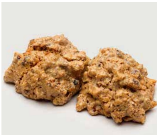
МЕРЕНГА ФУНДУЧНАЯ ..... 120 Hazelnut meringue 榛子蛋白脆饼