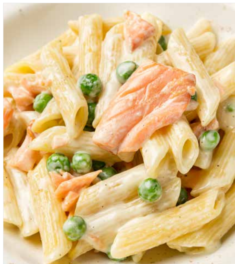
ПЕННЕ С КОПЧЕНЫМ ЛОСОСЕМ ..... 790 Penne with smoked salmon 熏三文鱼直通粉