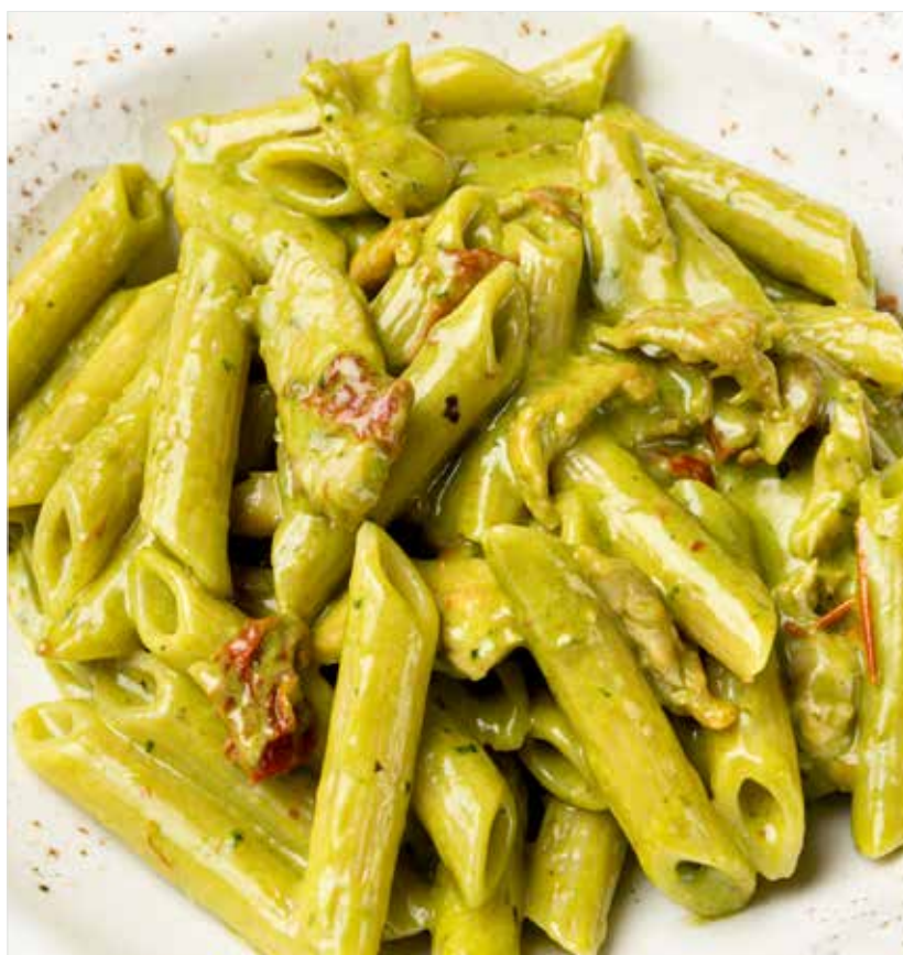
ПЕННЕ С КУРИНОЙ ГРУДКОЙ, ВЯЛЕНЫМИ ТОМАТАМИ, СОУСОМ ПЕСТО ..... 760 Penne with chicken breast and sun-dried tomatoes 直通粉配鸡胸肉和熏西红柿