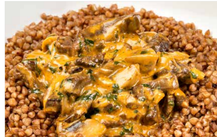
БЕФСТРОГАНОВ С ГРЕЧЕЙ / С ПЮРЕ

Beef Stroganoff with buckwheat / mashed potatoes